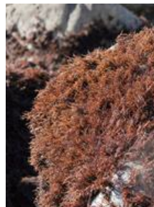
岩に茂ったフノリ