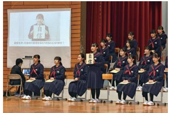
声高らかに目標を誓う生徒