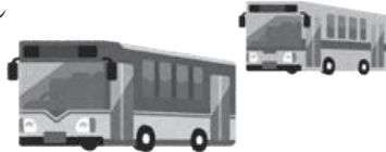
図 総合政策課 政策推進グループ ☎88-2113