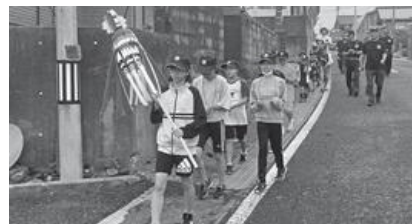
防火パトロールをするクラブ員たち

花火や迎え火などによる火災や事故が心配される時期に、クラブ員たちは拍子木を鳴らしながら「火の用心、マッチ一本火事のもと」と最後まで精一杯大きな声で呼び掛け、防火意識の啓発を行いました。