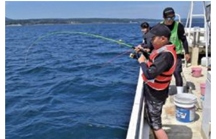
一本釣りを楽しむ参加者