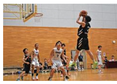
▲バスケットボール男子(攻撃側が階上町)