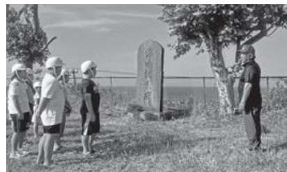
記念碑の前で話を聞くクラブ員たち

震災を知らない児童らにとって、自らの身を守るための知識を学ぶとても有意義な体験となりました。