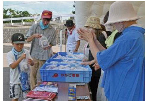
▲ビンゴ大会の景品を手にする参加者

ビンゴ大会の景品には同社製造の「どら焼きセット」もあり、参加者は袋いっぱいのだら焼きを手に取り笑顔を見せていました。