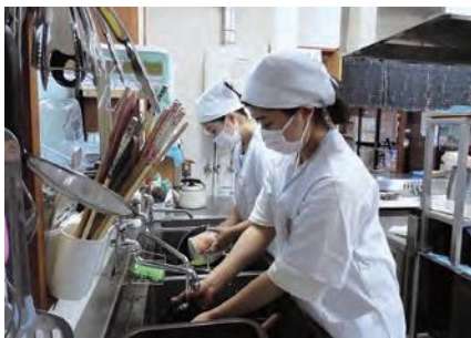
フォレストピア階上での活動の様子