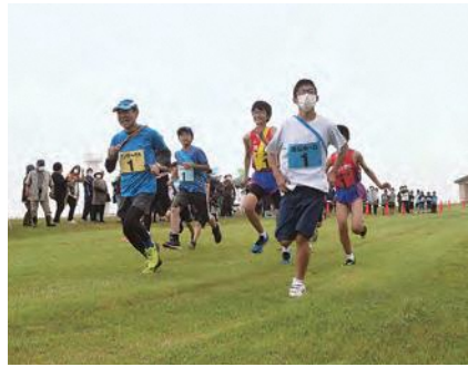
勢いよくスタートする参加者

7月11日、小舟渡廿一平付近を会場に「つなぐつなぐるはしかみりレーマラソン2021」が開催されました。タイムや着順に関わらず、みんな楽しく走ることを目的に開催され、参加者は芝生の上を思い思いに走っていました。