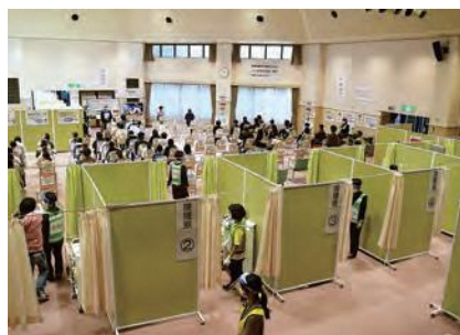
新型コロナワクチン集団接種会場の様子

10月24日、ハートフルプラザはしかみで行われてきた新型コロナウイルスワクチン集団接種（2回目まで）が多数のご協力により無事終了しました。