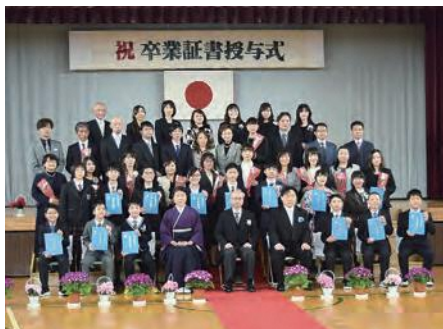
大蛇小学校卒業式

3月19日に小舟渡小学校、3月20日に大蛇小学校で最後の卒業式が行われました。閉校前の最後の式では、「皆さんの友情は変わらない」、「地域の皆さんに感謝したい」と、仲間や地域の人と共に過ごした時間を振り返っていました。