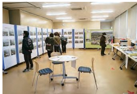
震災当時の写真や、防災グッズを展示した会場

東日本大震災から10年を迎え、3月6日から14日まで「はしかみNever Forget 3・11防災期間」として、あるでいしば2階に防災グッズやハザードマップ、震災当時の写真などを展示しました。