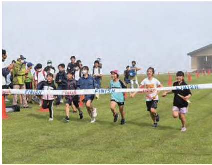
仲間と手をつないでゴール