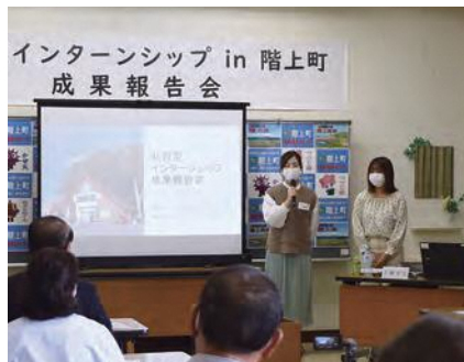
成果報告会の様子

2人は受け入れ先のフォレストピア階上で約1カ月間活動し、店のホームページの作成や、メニュー表を新しくしたことなどを報告。階上岳登山や巨木めぐりなどの体験から町の魅力も紹介し、「今回の活動を糧に地域づくりを学んでいきたい」、「心の底から階上町が好きになった」と笑顔で話していました。