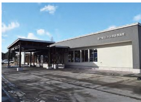
道の駅はしかみ道路情報館

休憩スペースや授乳室のほか、県内と岩手県内の一部の道路状況が分かるモニター、防災倉庫なども整備され、24時間利用ができる施設となっています。