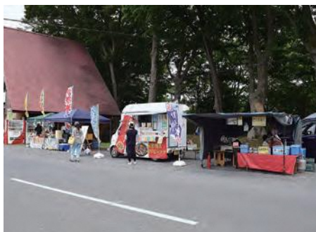
テイクアウトフェアも開催