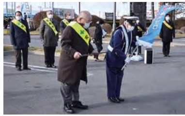
表彰を受けた交通安全協会階上支部と交通指導隊階上支隊

セレモニーでは「交通事故死ゼロを目指す町」の看板の除幕式が行われ、次の目標である3000日へ向けて決意を新たにしました。