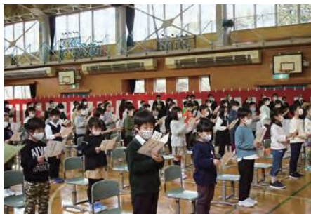
道仏小学校統合式で新しい校歌を歌う児童たち

3月末をもって大蛇小学校と小舟渡小学校が閉校したことに伴い、4月7日、道仏小学校で統合式が行われました。式では、児童たちが新しい校歌を高らかに披露。新しい仲間との学校生活に向けて、気持ちを新たにしました。