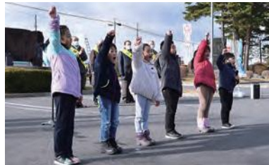
交通安全宣言を行う階上保育園の園児たち