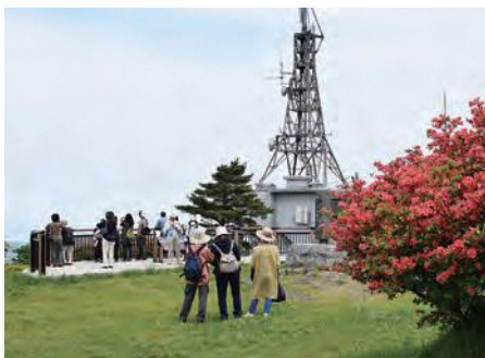
階上岳大開平でつつじを鑑賞する来場者

⑥階上岳つつじビューフェスタ 5月15日から6月13日まで階上岳つつじビューフェスタが行われました。期間中は登山口周辺に、つつじの開花情報パネルを設置したほか、キッチンカーや露店などが並び「テイクアウトフェア」も行われ、多くの来場者でにぎわいました。