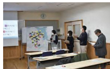
発表をする受講生

7人が講座を受講し、10月から講話や写真 de まち歩き、ワークショップなどを実施。最終日のこの日は、受講生によるチャレンジプランの発表が行われ、受講生は「いいね!♡はしかみ~アナログインスタ~」と題し発表。SNSのインスタグラムのように、訪れた人や地元の人が地図に「いいね!♡」のシールを貼ったりコメントを入れたりしながら、地域の魅力を発見したり、発信する方法を提案しました。