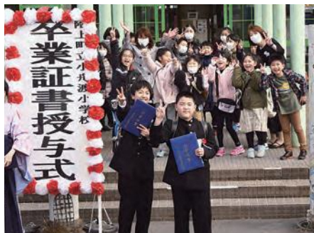
小舟渡小学校卒業式