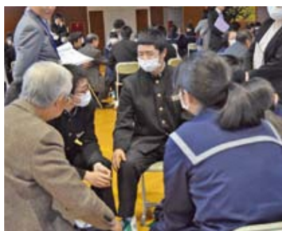
グループで意見を交わす参加者

参加した生徒は「家族との時間を大切に過ごしたい」「地域の人と一緒に考えることができてよかった。生きていることに感謝したい」と話していました。