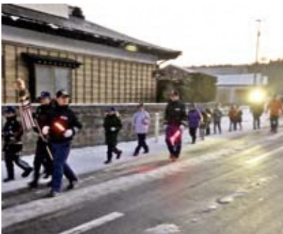
防火パトロールをするクラブ員たち

当日は、同小学校で構成されるクラブ員の児童と、町消防団第1分団の団員ら約25人が参加。出発式では「地域から火事を出さないようパトロールに出発します」と宣言し、クラブ員たちは気温0℃の雪道の中、拍子木を鳴らしながら「火の用心、マッチ一本火事のもと」と大きな声で呼び掛け、防火意識の啓発を行いました。