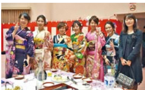
▲恩師や友人との再会を喜ぶ新成人