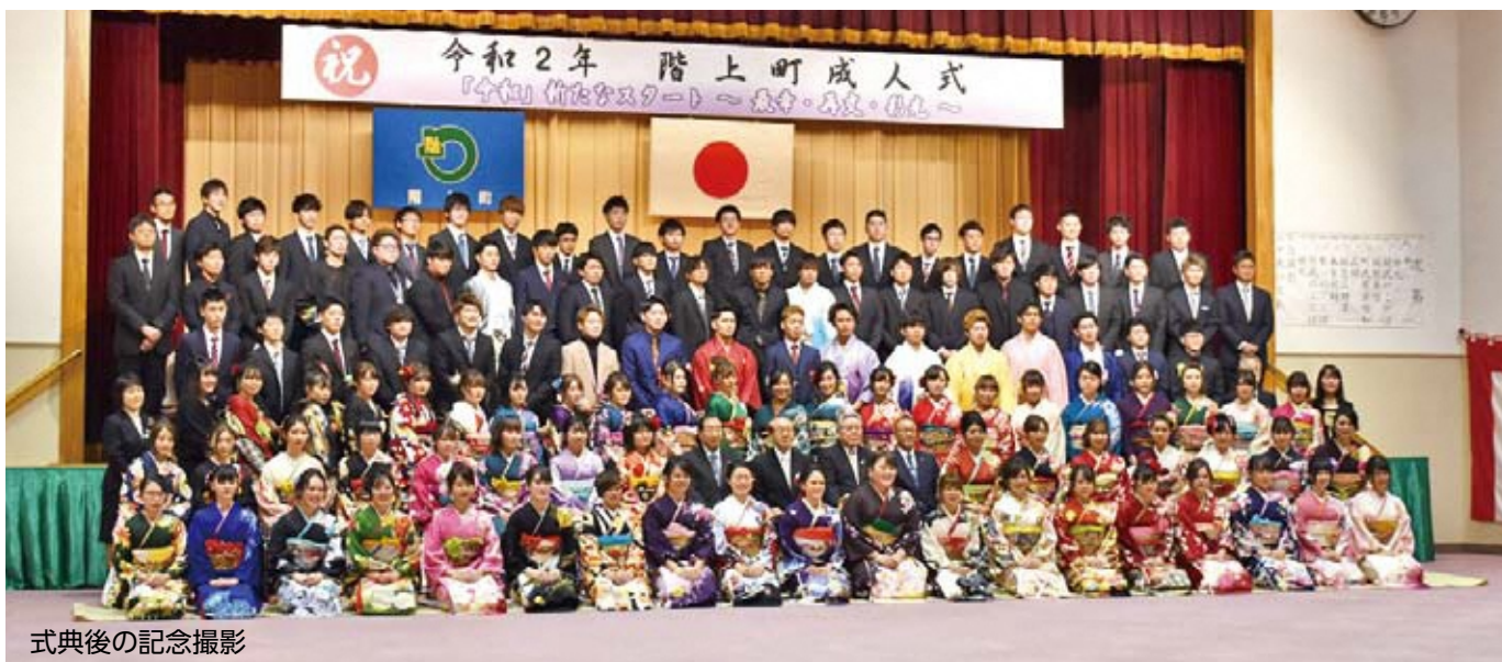
式典後の記念撮影