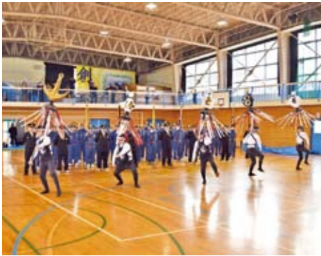
纏振りを披露(階上中学校体育館)

い年でした。自然災害や火災に、いかなるときでも対処できるよう備え、日頃の訓練により消防精神の鍛練と更なる技術の向上を期待します」と、