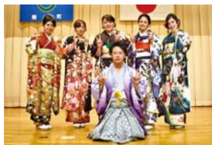
▲心に残る式を作り上げた成人式実行委員会のメンバー