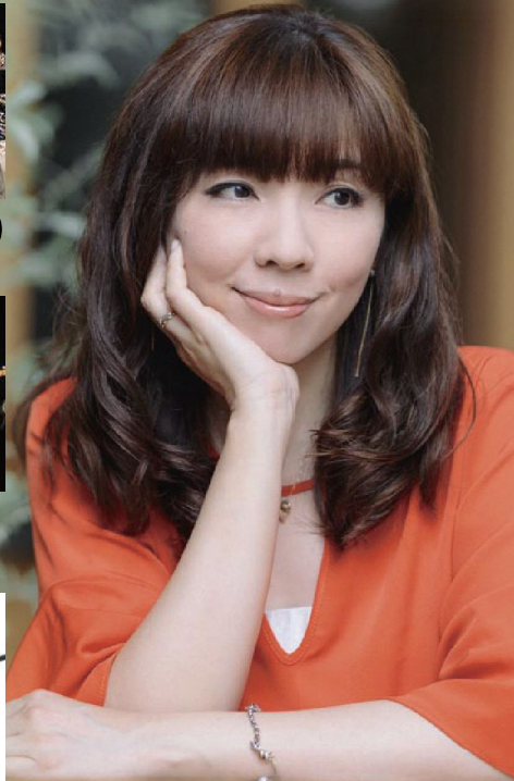
2日(日) 14:45～ 岡本 真夜 トーク&ライブ エフエム青森公開録音

●ラム肉及び牛肉コーナー (ラム肉・牛肉 各1,000円、野菜・タレ付き) -数量限定! 階上産ラム肉 1,200円