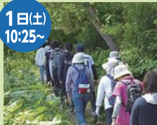
健康ウォーキング 10:25出発～12:30帰着