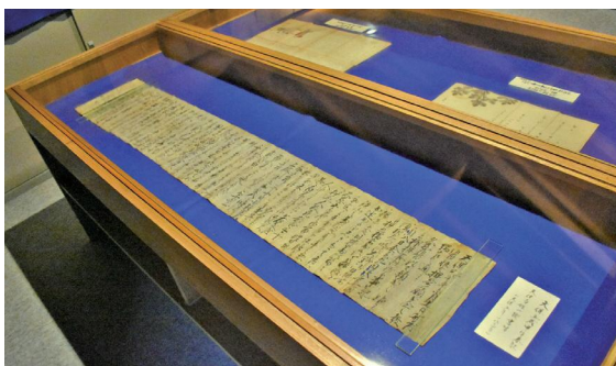
天保百姓一揆書留

史料は、寺下観音境内にある歴史資料館で保管・展示しており、5月に行われる寺下観音例大祭では、一般開放が行われます。