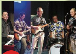
2日(日) 10:15～ HOTROD