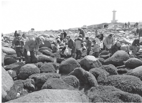
小舟渡の海岸で行われたふのり採りの様子