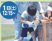
1日(土) 12:15～ 臥牛の里 丸太早切り大会