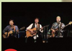
2日(日) 11:20～ がくや姫