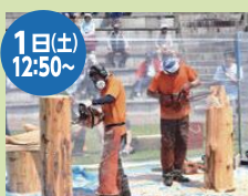
1日(土) 12:50～ チェンソーアート