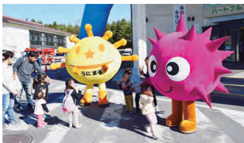
▲夢のコラボ!子どもたちに囲まれた「かぜ丸」(右)と「うにまる」(左)

2日間の来場者は約5,000人。今年には40回の節目を記念し、町の偉人太田広城特別展を開催。太田の功績をパネルや資料で辿るとともに、太田と関係の深い北海道奥尻島の物産展や同島マスコットキャラクター「うにまる」も来町。はしかみキッズの「かぜ丸」との撮影会も行われ、子どもたちに大人気でした。