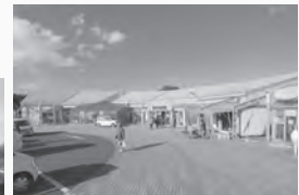
▲道の駅はしかみ ▼わっせ交流センター