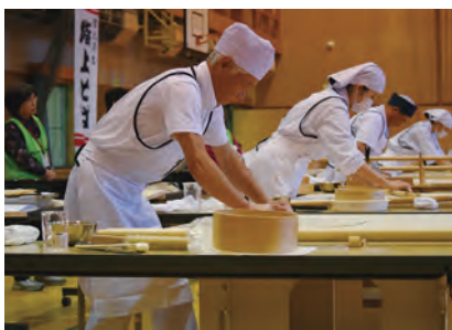
「全麵協素人そば打ち段位認定大会」の様子

平成25年からは、北東北で初めて階上町を会場に「全麵協素人そば打ち段位認定大会」が開催されるようになりました。現在、町内には初段位11人、二段位15人、また三段位が2人います。