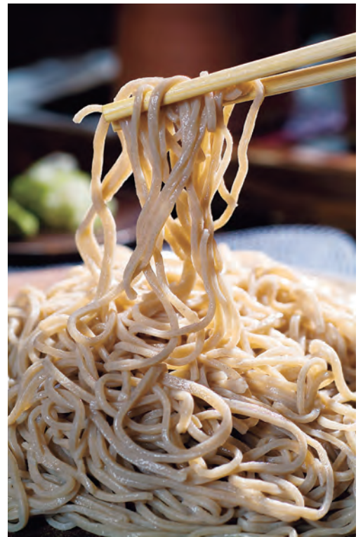
「階上早生」の名を世に広めてきました。

平成24年には旧登切小学校を改修し、製粉室やそば打ち実習室などを備えたそば振興拠点施設「わっせ交流センター」をオープン。着々と「階