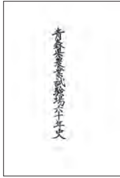
「青森県農業試験場六十年史」階上早生に関する記録が記されている。

その中でも寒さに強く、味に定評のあった階上産のそば。大正2年にこの地域を襲った大冷害にも負けず多く収穫できたため、当時の青森県農事試験場が大正4年にその種子を取り寄せ、調査と選抜を重ねました。試験栽培で優れた成績を残し、大正7年に「階上早生」と命名。青森県の奨励品種に採用されました。