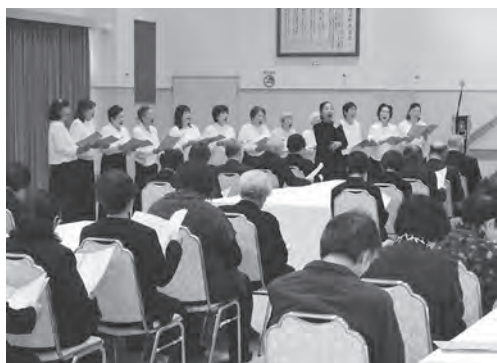
▶ 戦没者を悼み追悼合唱 ▲ 平和への願いを込め献花

式では、戦没者236柱の御霊の御冥福を祈り、祭壇に献花し、「レデイースコーラスはしかみ」のメンバーと参列者が、一緒に平和への願いを込めて「ふるさと」の曲を追悼合唱しました。