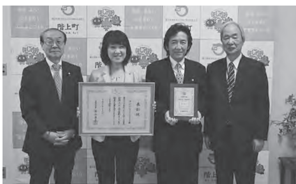
左から浜谷町長、水梨子会長、三河副会長、川浪教育長

水梨子広恵会長は「町主催の水泳教室に参加したことが設立のきっかけであり、保護者主体の運営で14年間続けて