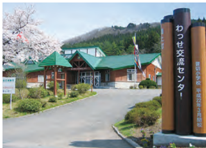
そば振興拠点施設「わっせ交流センター」