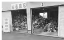
今年もたくさんの古着が集められました

古着回収は今年で3回目となりますが、多くの来場者から「ありがたい」、「来年度も実施してほしい」といった声をいただき、大好評のうちに終わることができました。ご協力いただきありがとうございました。