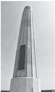
奥尻町指定文化財「徳洋記念碑」