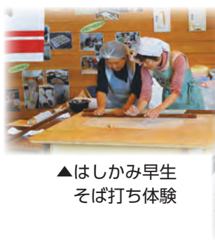
▲はしかみ早生そば打ち体験