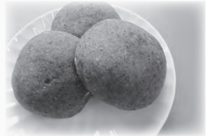
口当たりよく、濃厚なよもぎの香りが広がる