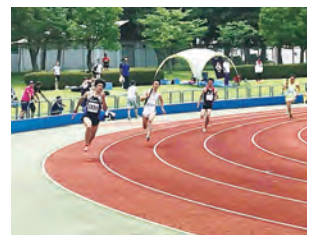
陸上競技(一番左が階上町)

中央体育館では剣道競技が開催され、町村の部、市の部ともに白熱した試合が展開されました。