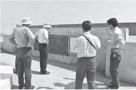
奥尻町職員(一番右)から説明を受ける町文化財審議会委員

さて、去る7月25日から26日の2日間にわたり、町文化財審議会は太田広城生誕180年にあたり、太田のた