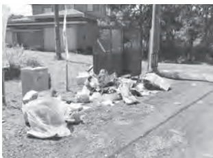
ごみ集積所への不法投棄

不法投棄とは、廃棄物をみだりに道路や空き地 (自らの土地を含む) などに捨てる行為です。不法投棄をした、またはしようとした場合には、 5年以下の懲役もしくは1,000万円以下の罰金または併科の厳しい罰則が設けられています。 なお、昨年度、町では不法投棄が約9 t回収されました。