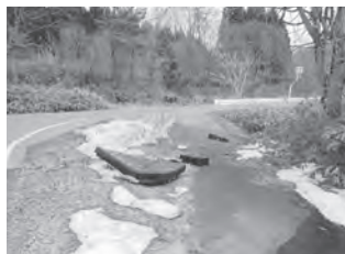
道路脇への不法投棄