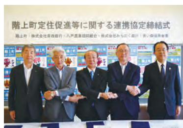
協定書を取り交わし、握手をする浜谷町長（中央）と各機関の代表者

協定の締結により、町の定住促進事業を利用する場合は、4金融機関から住宅ローンなどの金利の優遇を受けることができます。