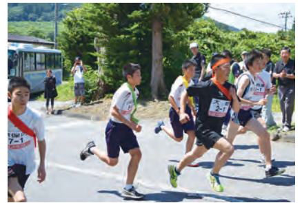
第1区：平内農道入口から一斉にスタート

第31回階上町内駅伝競走大会が7月1日に開催されました。気温、湿度がともに高く蒸し暑い中、昨年より1チーム多い7チーム63人の選手が22.2kmをたすきでつなぎました。開会式では、鳥屋部支部の階上小学校児童5人が「最後まであきらめず大切な仲間のために絆というたすきをつなぐことを誓います」と選手宣誓をしました。