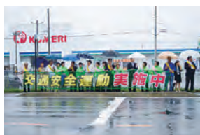
街頭広報活動の様子 (7月23日 階上町役場前)