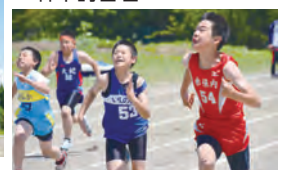
▲記録に挑む選手たち