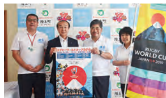
浜谷町長とキャラバン隊の皆さん

7月末には津波で被災した地域の小中学校跡地に「釜石鶴住居復興スタジアム（仮称）」（釜石市）が完成し、このスタジアムでRWCの試合が来年9月25日と10月13日に開催されます。