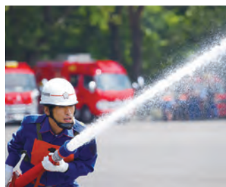
躍動する町消防団員