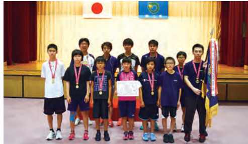
2連覇を達成した赤保内支部

レースは中盤まで石鉢ガッツが1位を走り続けましたが、後半で赤保内支部が逆転。そのまま逃げ切り、昨年に引き続き見事2連覇を果たしました。