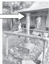
(左) 五重塔 (上) 日向山頂上の灯明堂と倒壊した五重塔相輪部分