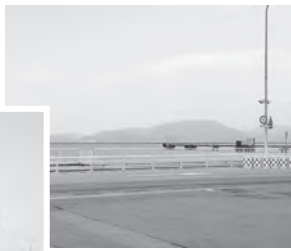
青森港より陸奥湾を望む

植林するといった産業を興しました。さらに漁法を改良するなど、人々の生活向上を図り、大きな信頼を得ていました。この行動を見ていると、三沢市の谷地頭開拓や県役人時代に培った様々な経験をいかんなく発揮しており、この後奥尻へ渡るきっかけもなつたといえます。