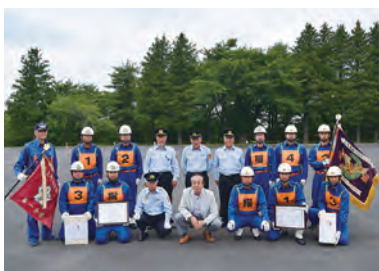
県大会出場を決めた第1分団