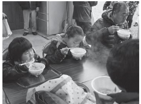
家族で楽しむ地元の味、どんこ汁