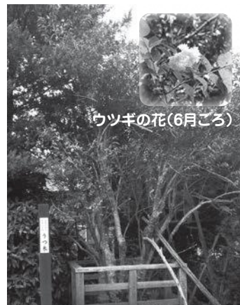
ウツギの花(6月ごろ)

※木によっては管理者の許可または階上売り込み隊のガイドが同行しなければ立ち入ることはできません。