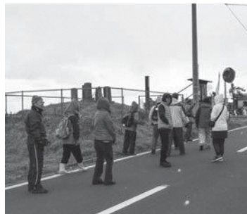
魚介試食ありの楽しいまちあるきコース

朝から多くの来場客で大賑わいでした。この日、同時に開催された階上まちあるき線路ぐるりんコースも人気で、参加者は約3kmの道のりを散策して、楽しんでいました。