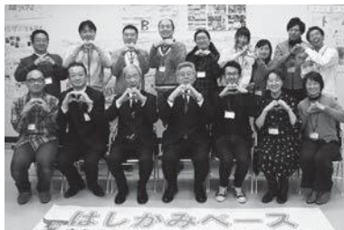
最後に全員で「LOVE はしかみ」

閉講式では5人の受講生に修了証が手渡されました。受講生は「学んだスキルや知識を、地域に持ち帰って役立てていきたい」と話していました。なお、講座の様子は今後レポートとして町ホームページで公開される予定です。