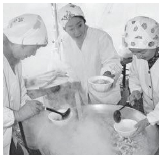
どんこ汁いかがですか？