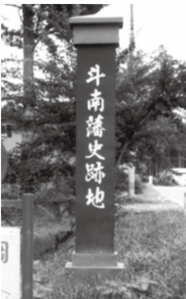
斗南ヶ丘にある史跡地 市街地の建設を行ったとされる場所 (現むつ市)

しかしそれを知つて知らずか、明治4年（1871）7月、明治新政府の中央集権化の一大政策である廢藩置県が發布され、現在の青森県域には五県（八戸、七戸、斗南、黒石、弘前）が誕生し、斗南藩は2年を待たずに幕を閉じることとなったのです。