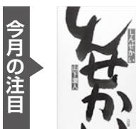
『しんせかい』 山下澄人 著