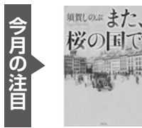
『また、桜の国で』 須賀しのぶ 著