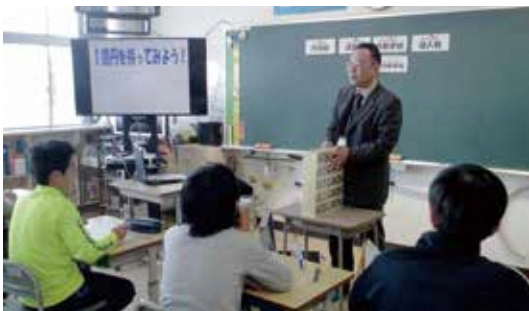
真剣に講師の話を聞く大蛇小児童

租税教室は、税に対する興味や関心を高め、自分たちの生活と税が密接に関わっていることを知ることで、税の必要性について理解することを目的に、小学生と中学生を対象に毎年開催されています。講師は町税務課の職員が担当し、ビデオ学習やクイズ等を交えながら税金の使い道や大切さを説明しました。