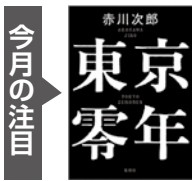
『東京零年』 赤川次郎 著