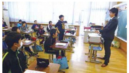
積極的に意見を発表する道仏小児童

また、1億円のレプリカを手にした児童らは、その重さに驚きと歓声を上げていました。