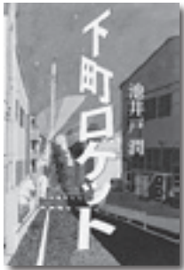
『下町ロケット』 池井戸潤 著 小学館

その特許が無ければロケットは飛ばない。町工場が取得した最先端特許をめぐる、中小企業と大企業の熱い戦いを描いたエンターテイメントビジネス小説。直木賞受賞作。