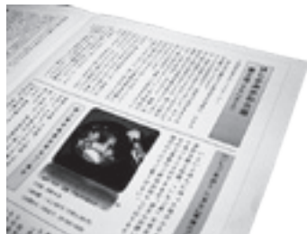
会報はしかみかわら版 (年4回発行)

階上町には、階上早生や海藻ラーメン、いちご煮など数多くの商品がありますので、今後はホームページを通じて階上町と特産品のアピールに協力していきたいと考えています。