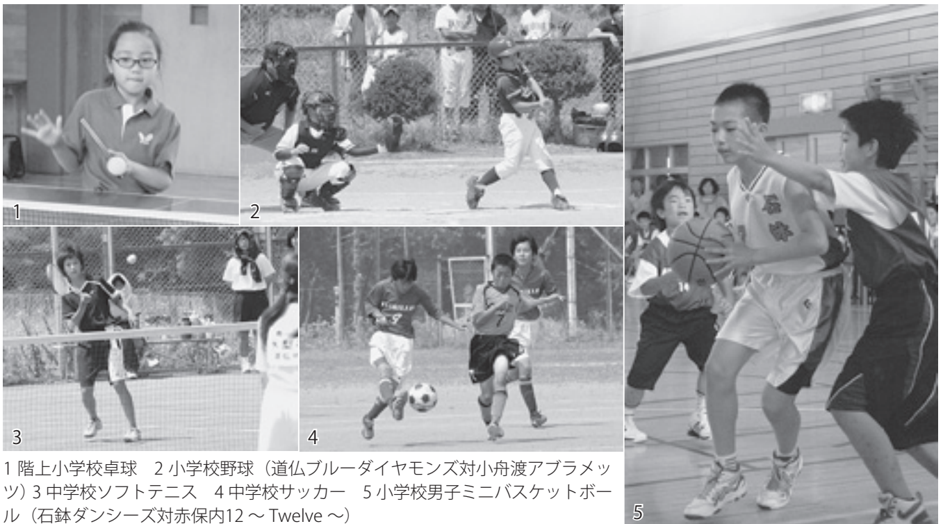
1 階上小学校卓球 2 小学校野球（道仏ブルーダイヤモンド対小舟渡アブラメツ）3 中学校ソフトテニス 4 中学校サッカー 5 小学校男子ミニバスケットボール（石鉢ダンシーズ対赤保内12～Twelve～）