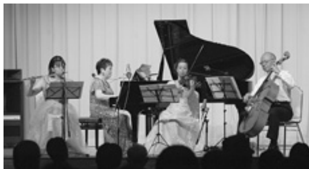
美しい音色が会場に響きわたったコンサート

参加者は曲の解説を聞きながら、会場いっぱいに広がる素晴らしい音色に耳を傾けていました。