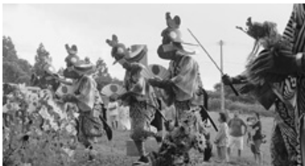
念仏を唱えながら墓の周りを踊る平内鶏舞

この日は、同組の12人が墓地の周囲を「オントリドリ」「前念仏」「イドナサド」「念仏」などの演目で約20分舞い踊り、先祖のみ霊を供養しました。墓地にはもの悲しい笛の音が響き、墓参りに訪れた人は手を合わせ静かに祈っていました。