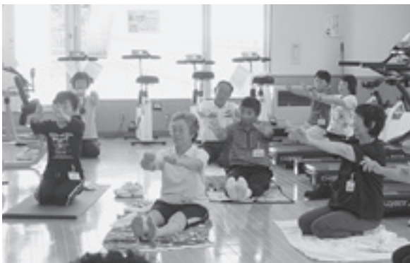
保健福祉課で実施している生活習慣病予防のための健康教室「おなか-2cm倶楽部」

その中でわが町は、男性は下から45位(76・4歳)、女性は下から560位(85・4歳)