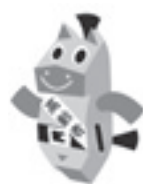
高齢者を交通 事故からまも るくん

・子どもと高齢者の交通事故防止 ・夕暮れ時と夜間の歩行中、自転車乗用中の交通事故防止 ・全ての座席のシートベルトとチャイルドシートの正しい着用の徹底 ・飲酒運転の根絶