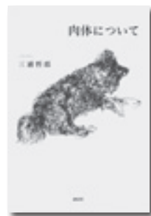
『肉体について』 三浦哲郎 著 講談社

己の自由にならない肉体を見つめ、老いてゆく自分への好奇心。人生を振り返る著者最後の小説。少年の日の思い出を通して語られる家族、優しい光に満ちた日常。