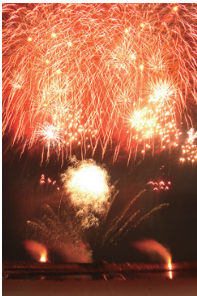
復興への思いをのせて大輪の花火が夏の夜空を彩った

8月14日、大蛇小学校で大蛇夏まつりが開催されました。大蛇、追越、荒谷地区の合同夏祭り今年で5回目。