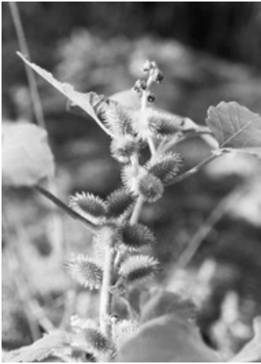
子どものころからなじみ深い

方言名には、果実の形状や性質から、カミノキ・ドロボウ・ホシダマ・ヤマゴンボなどがある。