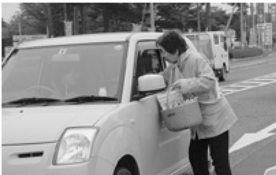
交通安全を呼びかける母の会会員

その後、役場前交差点で、横断幕を掲げたり、ドライバーに「安全運転お願いします」「交通安全運動が始まりました」などと声をかけたりしながら、マスケットやチラシなどを手渡し、交通安全を呼びかけました。