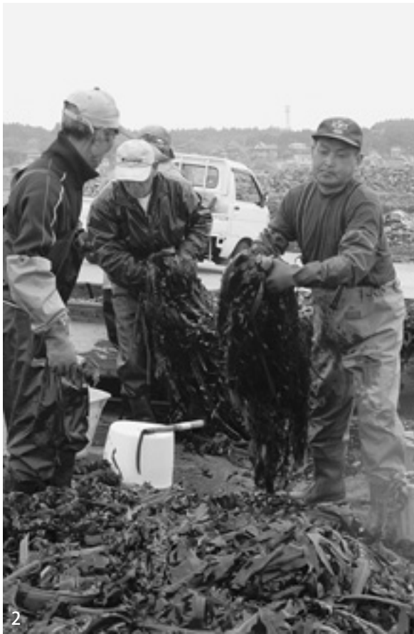
1 手際よくワカメの選別をする部会員（荒谷部会） 2 舟いっぱい採ったワカメを降ろす男性たち