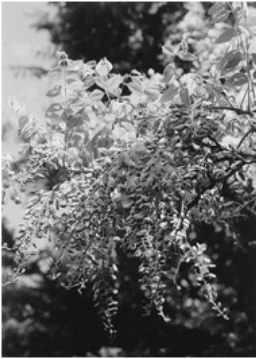
藤色の由来となった花

幹はかなり太くなるものもある。小葉は十一〜十九個つき、縁が滑らかで、二十〜三十センチくらい。つるは右巻きになる。夏に長い総状花序を出して垂れ下がり、紫から淡紫色の花をつける。