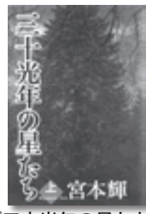
『三十光年の星たち』 宮本輝 著 毎日新聞社

「君の人生は終わったも同然。謎のことばをかける老人と青年は旅に出る。京都の小路からはるか宇宙の時間を宿す深遠な生の森へ」。宮本 文学の到達点！