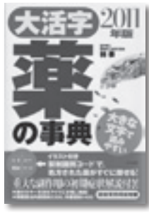
『大活字薬の辞典 2011年版』 林泰 著 ナツメ社

薬の効用や相互作用、副作用、注意点、薬価などが簡潔にまとめられています。大活字で見やすく、気になる薬がすぐに探せる事典です。