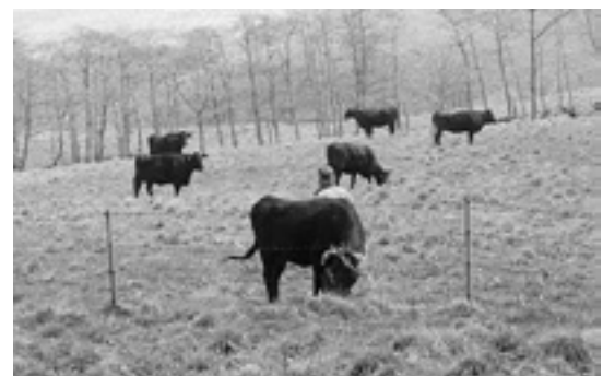
草をはみ、のんびり過ごす牛たち

牛たちは、43・7畝の広大な放牧場の中で青々と茂った草を食べるなどしてのびのびと過ごしていました。利用者は15人（町内12人、八戸市南郷区3人）。放牧は10月31日まで行われます。