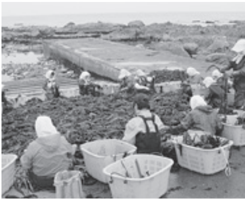
ハマが活気づくワカメの共同採り

多くの方からの貴重な浄財に報いるためにも、今一度協働に向けた漁業者の意識改革と組織改革の取り組みによって一日も早く、にぎやかなハマを取り戻してほしい。