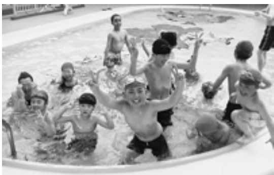
元気いっぱい水の中で遊ぶ子どもたち