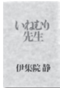
『いねむり先生』 伊集院 静 著 集英社

妻の死後、アルコール依存、ギャンブルにおぼれていたボクは「いねむり先生」こと色川武大に出会い、暖かい交流の中で再生を果たす。伊集院 静自伝的小説の最高傑作！