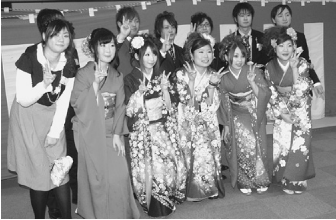
成人式でのひとコマ。久しぶりに再会した友達同士写真を撮りあう姿があちこちで見られた