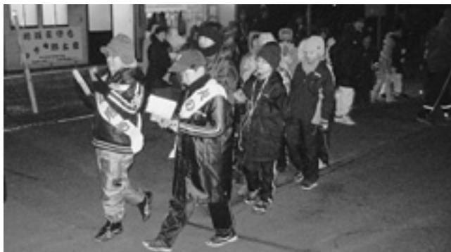
拍子木を打ち、火災予防を呼び掛ける子どもたち

その後、3地区に分かれ、拍子木を打ちながら「火の用心、ご用心、心で用心、目で用心」などの防火用語を連呼し、住民に火災予防を呼び掛けました。