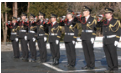
青空に鳴り響くラッパ隊の音色