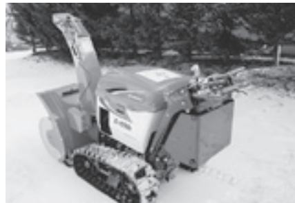
整備された除雪機 ▶

道仏行政区は、平成23年度財団法人自治総合センターの一般コミュニティ助成事業を活用して、除雪機1台を整備しました。 今後は、地区の歩道などの除雪に活用されます。