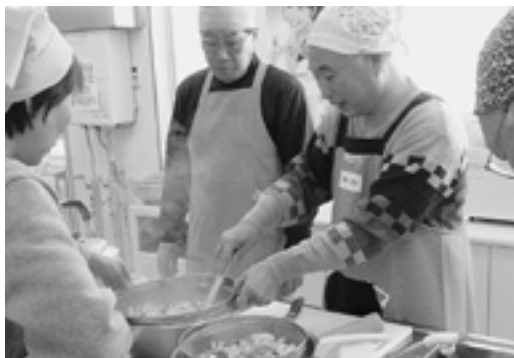
食生活改善推進員の指導を受けながら調理に挑戦する参加者

また、参加者の家族も参加し、調理の間に運動を行うなど家族で健康づくりへの関心を高めました。