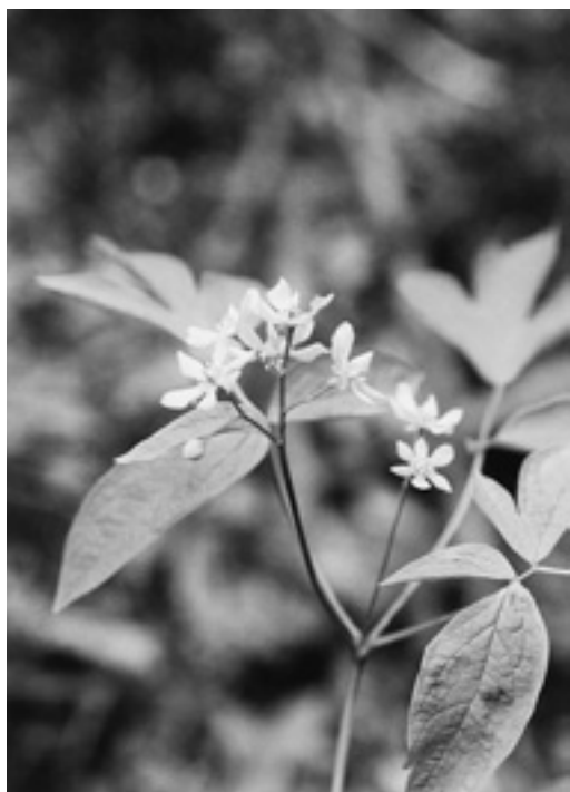
シャープな形の花

和名は「類葉牡丹」と書き、葉が牡丹の葉に似ていることから、この名がついたという。北海道・本州・四国・九州に分布。仲間はない。