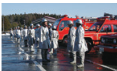
機械器具点検を行う団員