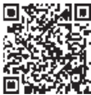
QRコードからも読み込めます

anzenjoho@anshin.city.hachinohe.aomori.jp