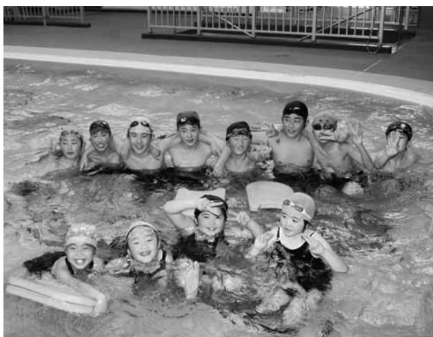
プールオープンを楽しみにしていた子どもたち

初日のため無料開放されたこの日は約100人が利用。久しぶりの水の感触を思い思いに楽しんでいました。町民プールは10月31日まで利用できます。