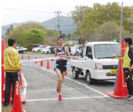
大会結果(上位3位/敬称略)