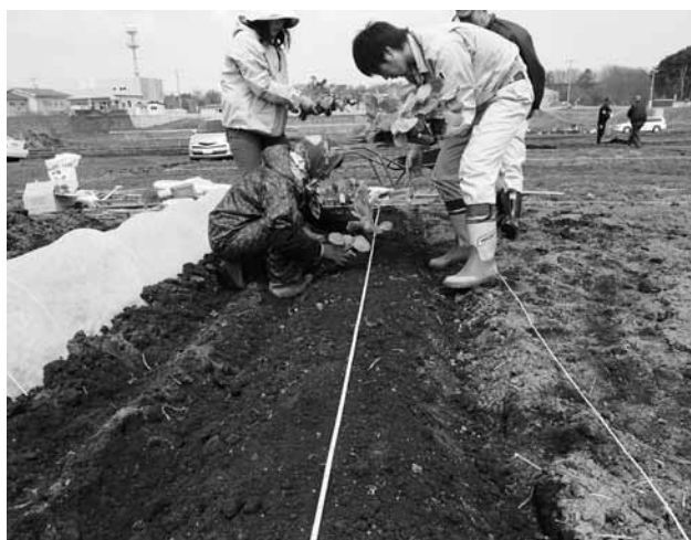
キャベツを植える利用者たち