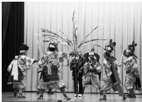
郷土芸能平内鶏舞

また、2日間にわたって階上早生ざるそば早食い大会が行われ、町内外の子どもから大人まで10名が参加。2人前のそば早食いに挑戦し、会場からはたくさんさんの声援があがっていました。