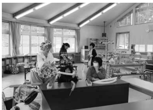
体験コーナー バロンアート