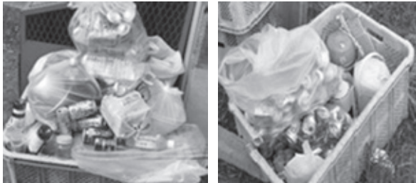
（写真）誤って出された燃やせないごみと資源物が混在している。

町では、6月2日の収集日以降、町内の燃やせないごみ排出状況を確認しましたが、これまでどおり毎週出されている所が見受けられます。