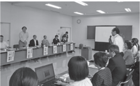
現地懇談会に県知事来町

その後、保健師一人一人から若い世代の健康づくりや介護予防対策について発表があり、包括ケアの意義を再確認し、効果的に事業展開するための契機とすることができました。