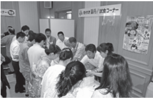
大盛況だった殻付きウニ試食コーナー

ら階上に元気を送ろうと始めたこのイベントももうすっかり定着し、階上町を応援してくれる出身外のサポーターが増え新たな意気込みも提案されたことは喜ばしい限りです。会員有志との懇談会では、特に町内観光拠点施設に対して外から見た提言や要望が多く出されました。情報発信、特産品の販売PR方法、町の顔としての在り方など厳しい指摘を受け、しっかりと認識して改革の意識をもって時流に沿った管理運営が必要であると感じました。また、キーワードである「交流人口の拡大」による活性化を図るためにも『ふるさと会』との連携をさらに深めることが重要であります。 結びに、会長の呼びかけでふるさと応援の件は即決、実行されたことに衷心より感謝申し上げます。