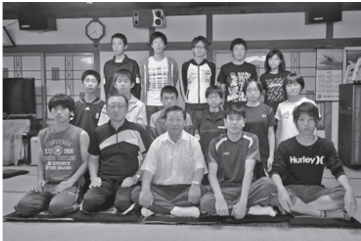
階上町選手団の皆さん