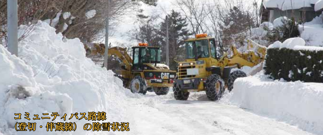
コミュニティバス路線 (登切・伴蔵線)の除雪状況