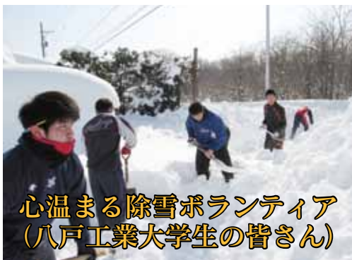
心温まる除雪ボランティア (八戸工業大学生の皆さん)