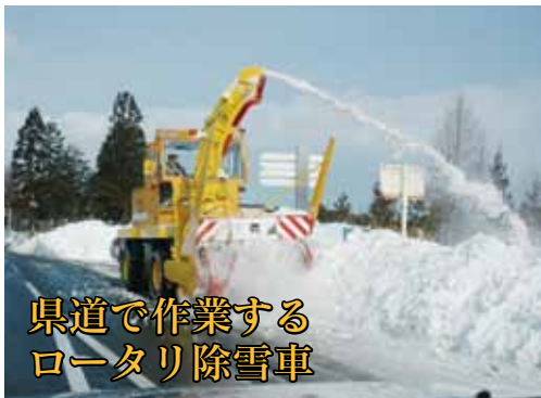
県道で作業する ロータリ除雪車