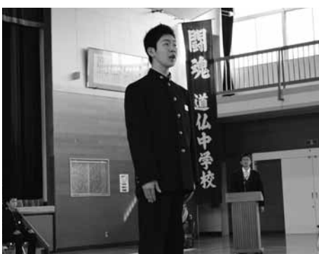
道仏中学校立志式での立志宣言の様子

田村校長は「自分たちの限界を乗り越えようという思いが今日の立志式に表れていた。この思いを忘れずに努力を続けていただきたい」と激励しました。