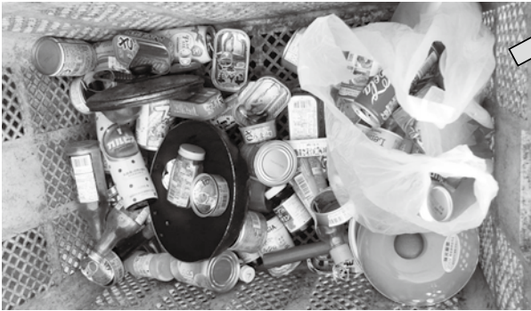
「写真」燃やせないごみに資源物が混入しています。こういった状況は各集積所でみられます！

ある月曜日の朝(燃やせないゴミの日)に各ごみ集積所を巡回し、分別状況を確認しました。その結果について報告します。