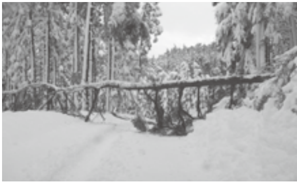
倒木により道路がふさがれている様子

また交通安全対策として、見通しの確保や木の落下による事故の未然防止にも、関係各位のご理解とご協力をよろしくお願いいたします。