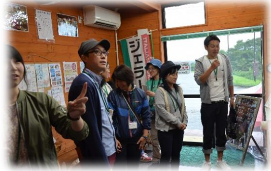
みんなジェラート大集合！！