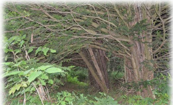
トンネルをぬけるとそこには・・・。