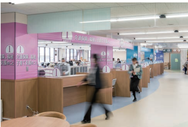
全面改修した役場1階フロア