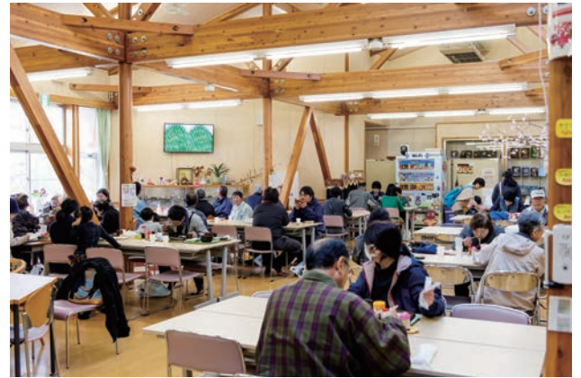
わっせ交流センターでの新そば祭り

町民や団体、行政等がそれぞれの役割を認識し、地域間で交流を図り地域が活性化するように、自主的なコミュニティ活動の推進に努めます。