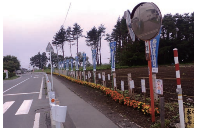
石鉢地区のあいさつ運動