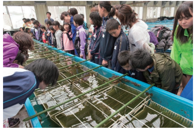
アワビの稚貝養殖（県栽培漁業振興協会）

産業関連団体との連携を強め、相互の役割を理解した上で、新たな地域資源の発掘や地域特産品の開発など、地域一体となった活力あふれるまちづくりを目指します。