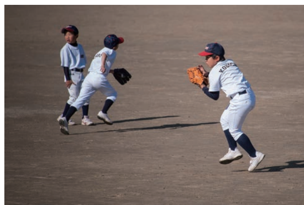
野球スポーツ少年団の練習

子どもから高齢者まですべての町民が豊かな心と生きがいを育むことができるよう、生涯学習の機会の充実と生涯学習のネットワークの形成に努めます。