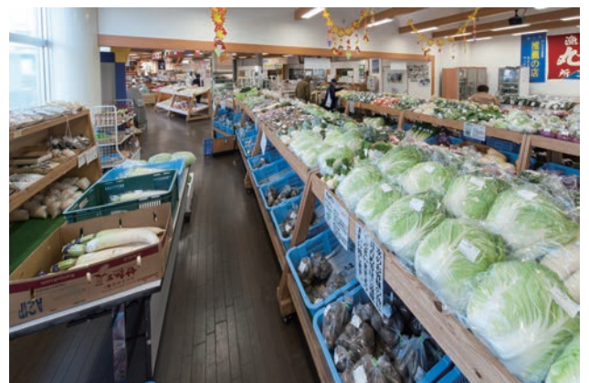
「道の駅はしかみ」の産地直売所