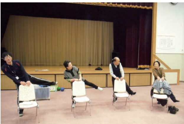
わんつか元気教室