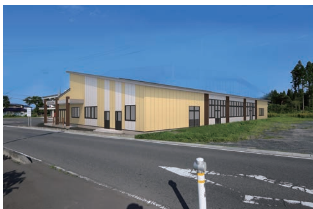
道仏コミュニティセンター(仮称)の整備(パース)