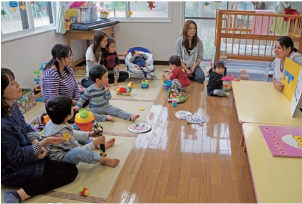
地域子育て支援センター

健康や福祉活動において複雑化・多様化するさまざまな町民ニーズへの適切な対応を図り、保健、医療、福祉のスムーズな連携による各種サービスの提供などに努め、すべての町民が健康で生きがいのある生活を送るために、ともに支えあう地域社会の構築を目指します。