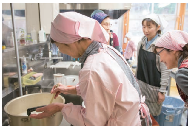
「学びの王国!はしかみキャンパス」での豆腐づくり体験 (わっせ交流センター)

町民と行政がまちづくりに対する意識を一つにし、その目標へ向かって互いに手を取り合い行動することができるよう、協働のまちづくりをさらに推進していきます。