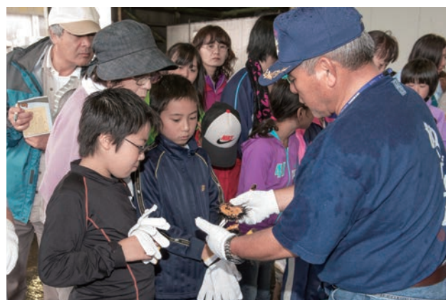
「海の学校」でのウニ殻むき体験