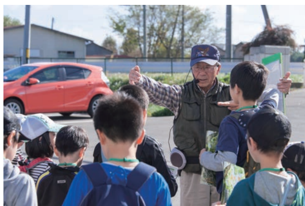
「わんぱく王国」で郷土を学ぶ