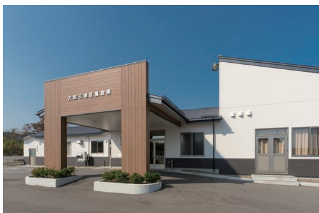
移転新築した大蛇三地区集会所