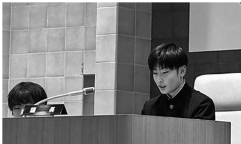
3年B組 鹿糠 議員 天 議長

問 ソーラーパネルの設置で設備の盗難、クマの出現増などを耳にした。町内のソーラーパネルの設置状況について、どのくらいの枚数が、どのくらいの予算をかけて設置されているのか。また森林の減少率についても聞きたい。