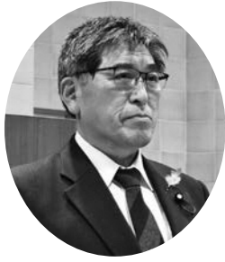
中島 孝一 議員