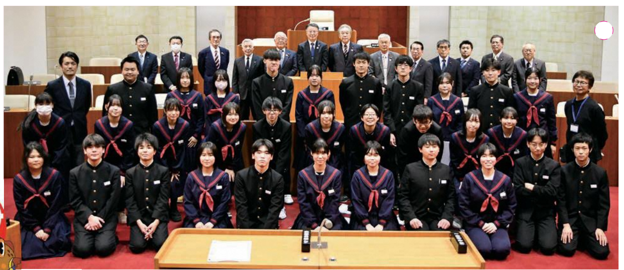
▶ 階上中学校 3年B組

中学生模擬議会 階上町の未来を担う中学生が、町政、町議会の仕組みや役割を学び、意見発表の機会を通じ、議会を身近に感じてもらうことを目的に、2回目の中学生模擬議会を開催しました。議長や議員を体験し、答弁者となる議員に自ら考えた質問を問いました。