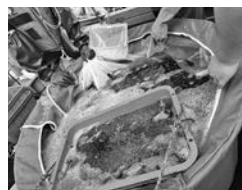
連携した流の放流と事業の連携の様子

環で昨年度藻場礁を設置した。さらに栽培漁業振興協会から購入したマコソウの種糸を使う増殖への取り組み、またドブ漬けという手法による昆布の栽培養殖に取り組んでいる。またウニやアワビなどの計画的な種苗放流を行うなど対策を進めている。