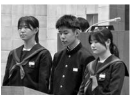
3-A 6班 藤 友加 議員 つとむの空 議員 こまつほの春 議員 おの前の星 心春 議員

問 国道ではない道が整備されていないように感じる。特に登下校時は歩道が狭く、車道と歩道を分ける縁石などが無いため車が近くとも危険である。今後、階上中学校の学区内で歩道を整備する予定はあるか。歩道の縁石の設置を要望する。