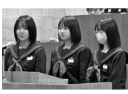
3-B 中村 兼 議員 3-B 田中 兼 議員 3-B 前 兼 議員 3-B 中村 兼 議員 3-B 田中 兼 議員 3-B 前 兼 議員

問 最近、不審者の情報をよく耳にする。下校中など、 1人の時は特に危険だと思ふ。町では不審者への対策 はどのようなことを行っているか。安全に歩けるよう 見回りなど強化してほしい。