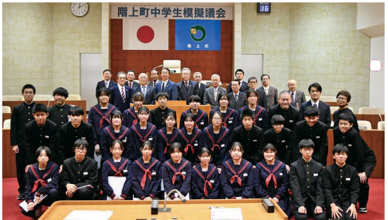
▶ 階上中学校 3年A組