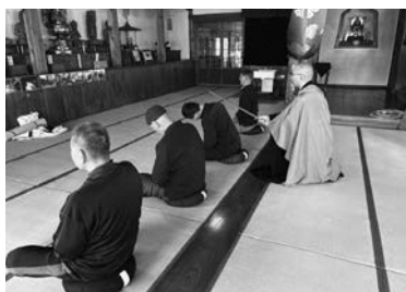
生涯学習活動（はしかみキャンパス）の様子

階上町の文化活動に対する貴重なご意見として受け止め、制度の在り方についても検討したい。