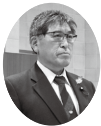
中島 孝一 議員