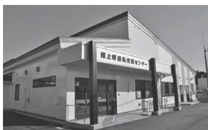
道仏交流センター