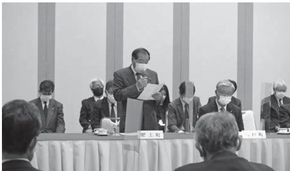
要望事項を発言する林議長

11月2日、ホテル青森で【知事を囲む行政懇談会】が行われました。各郡議長会代表による要望が行われ、三戸郡の発言者は階上町でした。議長が「主要地方道八戸階上線の拡幅・歩道整備及び柵踏切の改良について」を要望事項として発言しました。