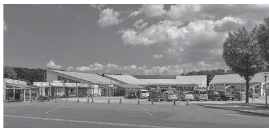
ふるさとにぎわい広場