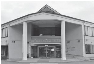
ハートフルプラザ・はしかみ