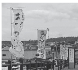
いちご煮フェスタ