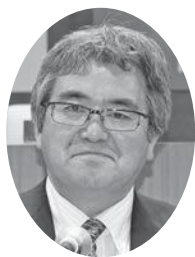
寅谷 正 議員

公共施設及びコンビニエ ンスストアへの配置のほ か、町内会への加入促進 に向けた取組みなどによ り、広く町民に必要な情 報が行き渡るよう努めて まいりたい。