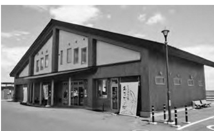
はしかみハマの駅あるでい〜ば