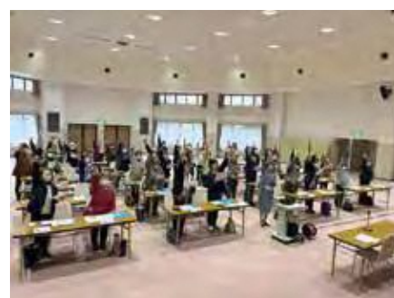
研修会にて標語を読み上げている様子