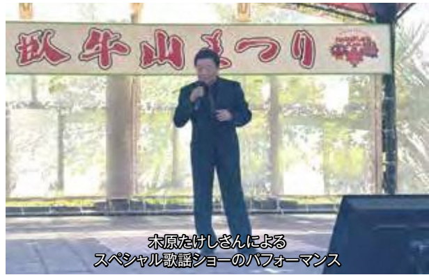
木原たけしさんによる スペシャル歌謡ショーのパフォーマンス