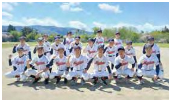
好成績を収めた階上BBC

これにより、5月23日にむつ市で開催された、第43回全日本少年軟式野球大会ENEOSTーナメント青森県予選への出場を果たしましたが、惜しくも1回戦敗退という結果となりました。今後のさらなる活躍が期待されます。皆さまの応援よろしくお願いたします!