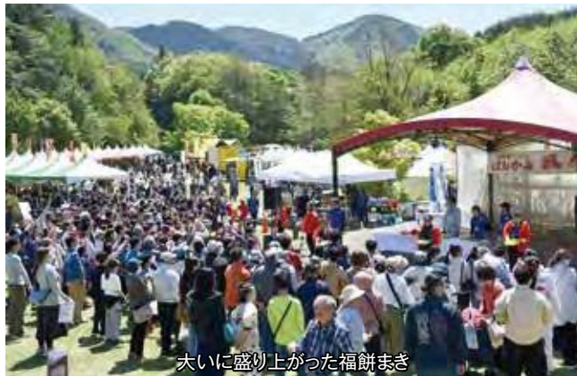
大いに盛り上がった福餅まき