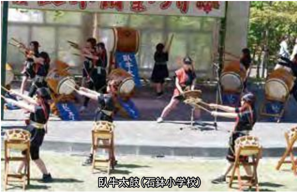
臥牛太鼓(石鉢小学校)