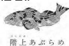
図 産業振興課 水産商工観光グループ ☎88-2875