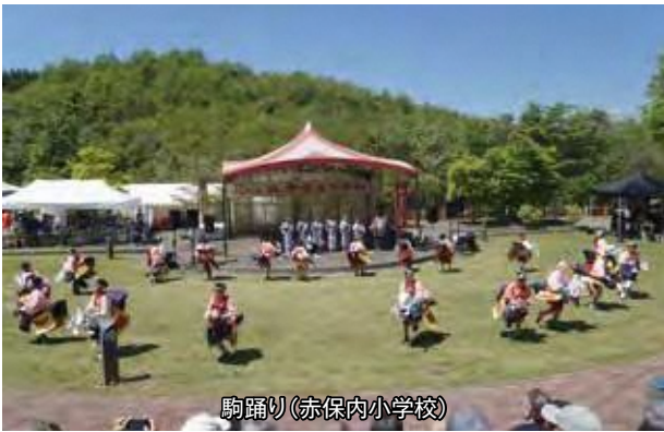
駒踊り(赤保内小学校)