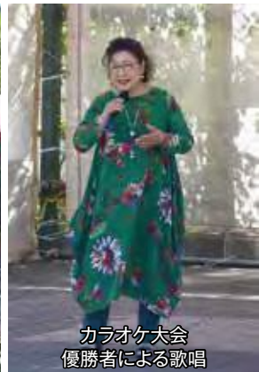
カラオケ大会 優勝者による歌唱