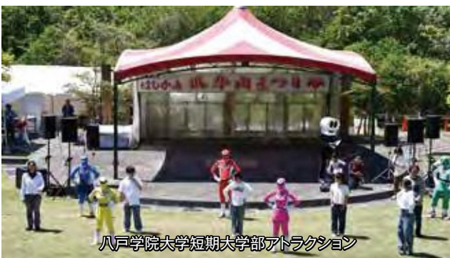
八戸学院大学短期大学部アトラクション