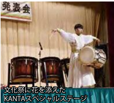
文化祭に花を添えた KANTAスペシャルステージ