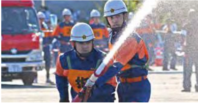
放水の力で勢いよく前方の的を射抜く