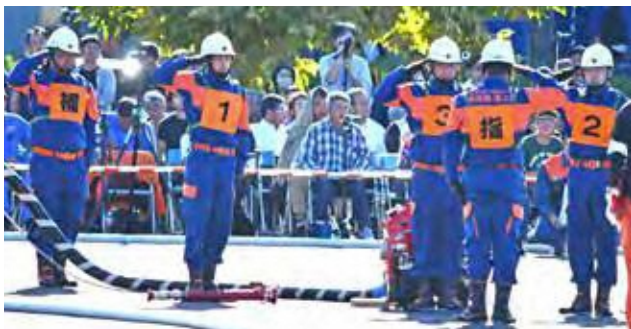
最後まで美しい操法を披露

プでくみ上げ、火元に見立てた標的に放水し、的を倒すまでの時間の速さと動作の正確さを競います。