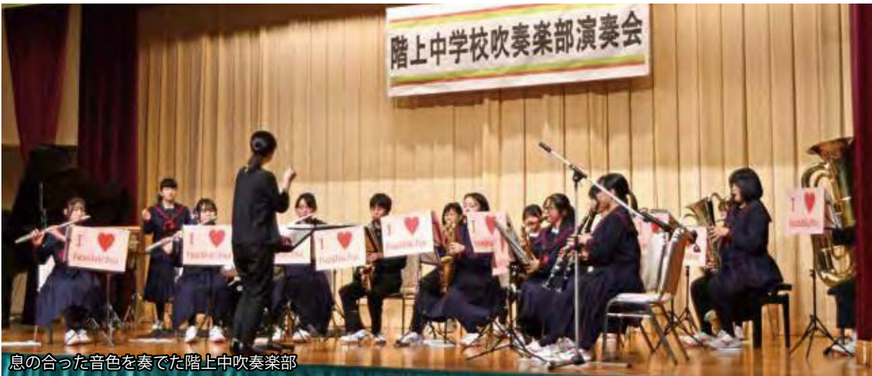
息の合った音色を奏でた階上中吹奏楽部