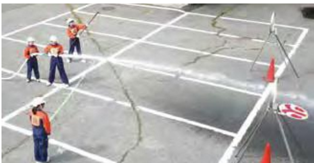
大人顔負けの操法を披露

結果は23隊中20位。目標とする順位に届かず肩を落とす第1分団でしたが、念願だった全国大会という大きな舞台で、日頃から意識している美しい操法を堂々と披露しました。