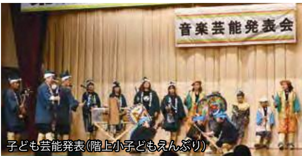
子ども芸能発表(階上小子どもえんぶり)