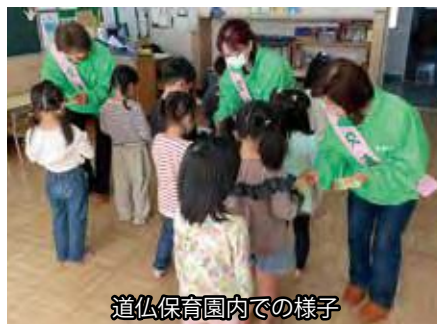
道仏保育園内での様子