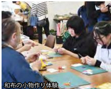
和布の小物作り体験