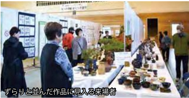
ずらりと並んだ作品に見入る来場者