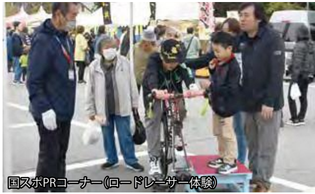
国スポPRコーナー(ロードレーサー体験)