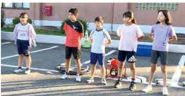
放課後や休日は役場駐車場で練習

操法を披露したクラブ員は、放課後や休日を利用して繰り返し練習を行い、本番では見事に3つの的を全て倒して、会場に集まった参加者から拍手が送られていました。