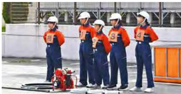
本番直前の真剣な面持ち