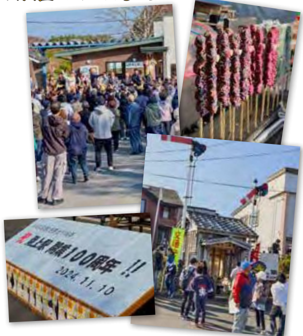
図 産業振興課 水産商工観光グループ ☎ 88-2875

今後お出かけする際は、たまには列車に乗り、きれいな海などの景色を見ながら気分転換をしてみたいはいかがでしょうか。