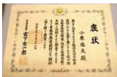
褒状と銀杯が贈られました