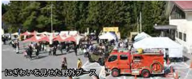
にぎわいを見せた野外ブース