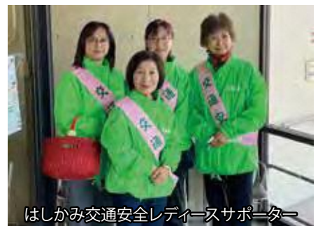
はしかみ交通安全レディースサポーター