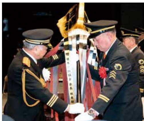
まといを受け取る南副団長(右)

3月21日には、町長への受賞報告が行われ、水合団長から「今回の受賞は、今日までの町と消防関係機関の理解と協力があったこそ。これからも消防団活動への変わらぬ支援をお願いしたい」と感謝の言葉が述べられました。