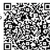
町ホームページ QRコード