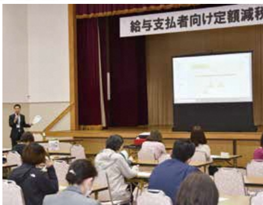
説明会を受講する参加者

参加した事務担当者は、「思った以上に煩雑な事務となるが、関係機関に確認を行いながら、ミスをしないように進めていきたい」と話していました。