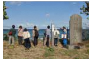
図 産業振興課 商工観光グループ ☎ 88-2875