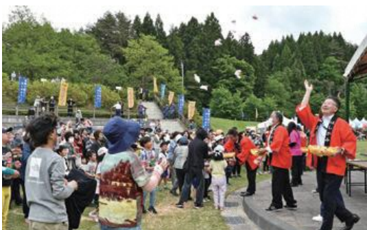
はしかみ臥牛山まつり