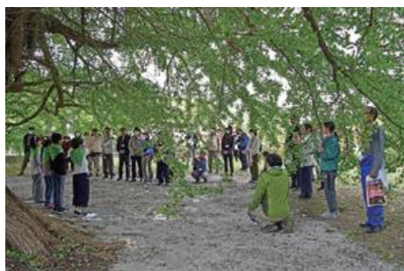
道仏小の「緑の少年団」の説明に 耳を傾ける参加者（銀杏木窪の大銀杏）

2日目には、全国から集まった参加者が3つのコースに分かれて、町内の巨木を巡りました。