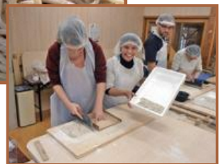
わっせ交流センターの そば打ち体験