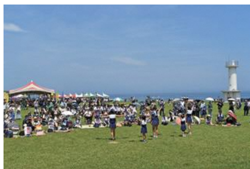
はしかみいちご煮祭り