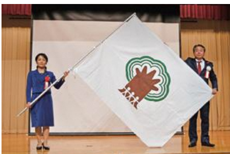
次回開催地に大会旗を引き継ぐ 荒谷町長（右）