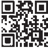
確定申告書等作成コーナーはこちら

事前準備が完了したら、国税庁ホームページの「確定申告書等作成コーナー」からマイナンバーカードを使って、マイナンバー連携を利用して確定申告書を作成できます。