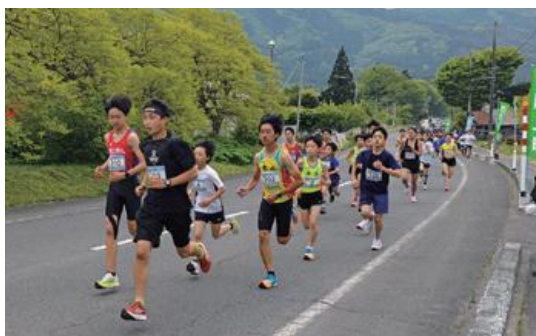
はしかみつじマラソン大会

5月8日に、新型コロナウイルスの感染症法上の位置付けが「5類」に移行し、町内で4年ぶりにイベントが開催されました。