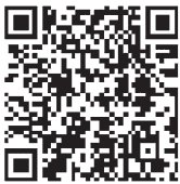
青森地方方法務局ホームページ

詳しくは、法務省ホームページを確認するか、青森地方方法務局登記部門までお問い合わせください。