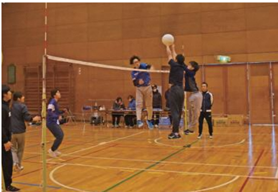
ネット上から放たれる鋭いスパイク