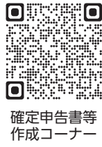
申告書等作成コーナー