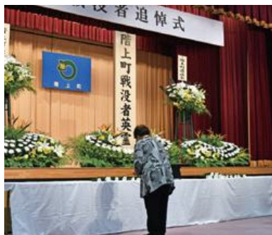
祭壇へ献花を行う参列者

階上町戦没者追悼式が10月28日、ハートフルプラザ・はしかみで行われました。約30人の参列者が町出身の戦没者を追悼するとともに、平和への祈りを捧げました。