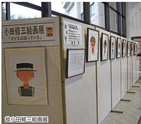
故小田修三絵画展