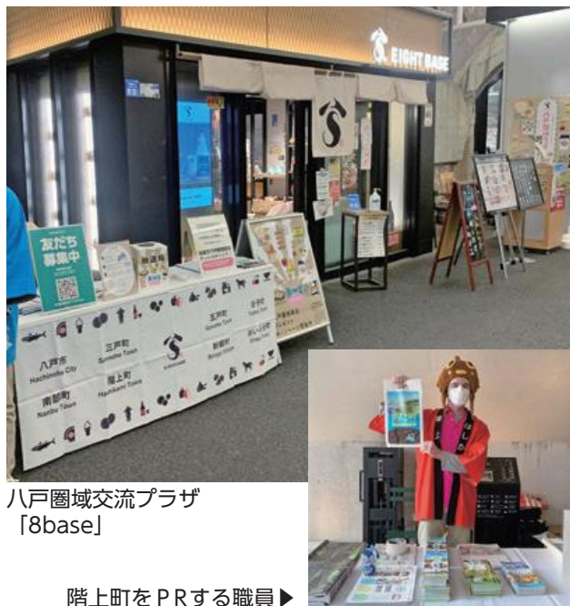
八戸圏域交流プラザ「8base」