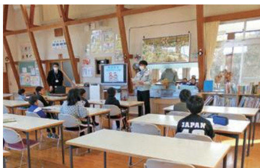
階上小学校での租税教室の様子

租税教室は、次代を担う子どもたちが、自分たちの生活と税が密接に関わっていることを学び、税の意義や役割を正しく理解することを目的として毎年開催されています。講師は町税務課職員が担当し、ビデオ学習やクイズなどを交え税金の使い道や大切さについて説明しました。 授業を受けた児童からは、「税金が身近であることが分かった」などの感想が寄せられました。