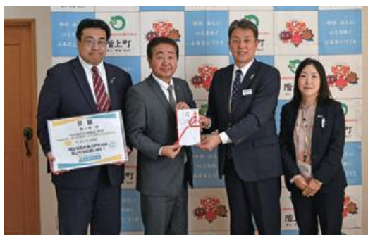
寄附金の目録贈呈式の様子

11月2日、明治安田生命保険相互会社から「地元の元氣プロジェクト・私の地元応援募金」として、寄附金の目録贈呈式を執り行いました。本町への寄附は、令和4年に続き行われており、地域住民の健康づくりや暮らしの充実に向け、地域にゆかりのある社員による寄附金や同社拠出金を合わせて寄附が行われます。