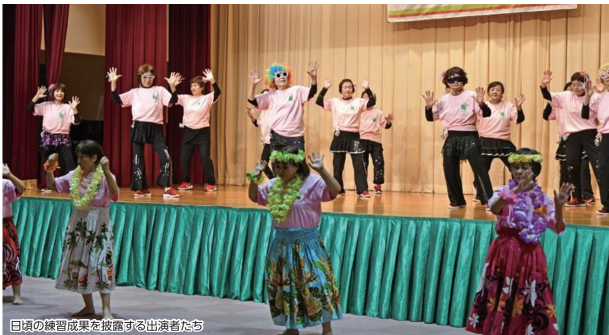
日頃の練習成果を披露する出演者たち