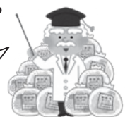
図 町民生活課 生活環境グループ ☎88-2119