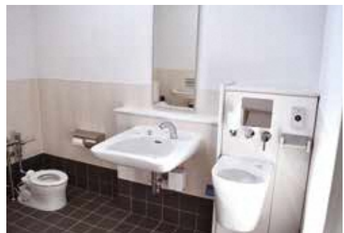
園 産業振興課 商工観光グループ ☎ 88-2875