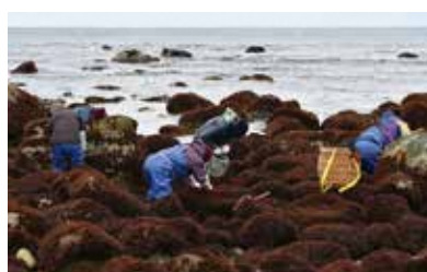
▲小舟渡生産部会のフノリ採りの様子