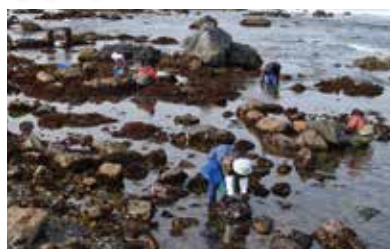
▲荒谷生産部会のフノリ採りの様子

フノリは海藻の中でも磯の香りが特に強く、みそ汁に入れたり、サラダにするなど階上の磯の香りが楽しめます。