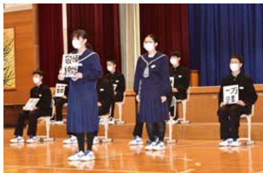
目標を声高らかに誓う生徒