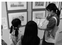
学芸員による展示会の案内