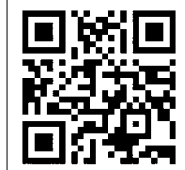
八戸市美術館 ホームページ