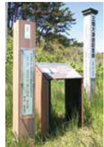
榊山海岸付近 (三陸大津波記念碑付近)