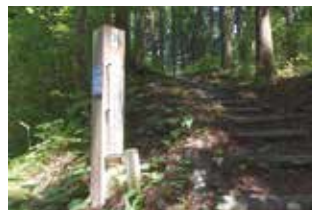
寺下観音 灯明堂付近