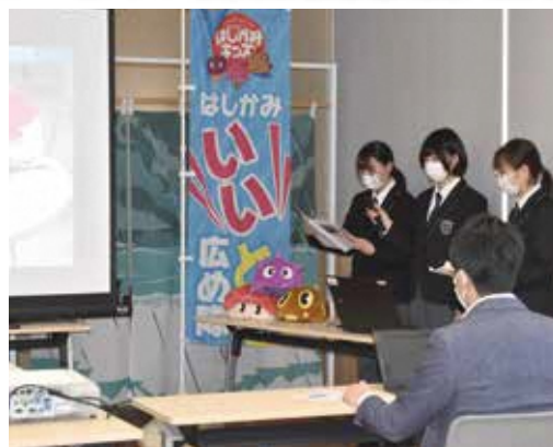
活動報告を行う生徒たち

参加者からは「同世代や小中学生にも階上の良さをつなげてほしい」、「階上で釣れた魚のPRをしても面白いのでは」などの助言があり、生徒たちは今後の活動に活かしていきたいと意気込んでいました。