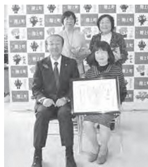
受賞した「にこにこクラブ」の皆さん

この活動には、安心して子育てをできるように、また、子どもたちが心豊かに成長してくれるようにといった願いが込められており、平成15年から約15年間、活動を続けて