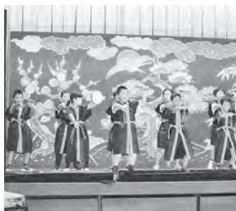
児童によるエイサー「安里屋ユンタ」演舞