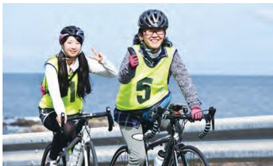
心地よい潮風を受けながら— 参加者からは笑顔があふれた