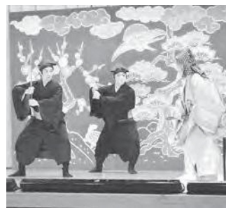
沖縄伝統組踊「子の会」による組踊