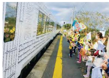
JR階上駅でお出迎えする人々

運行から5周年を迎えたのを記念し、10月20日は八戸駅で感謝祭が開かれたほか、町内では、階上駅や沿線から、階上保育園・道仏保育園の園児や沿線地域住民が、横断幕や大漁旗、小旗を振って、エモーション列車と乗客をお出迎えしました。