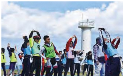
折り返し地点の階上灯台でストレッチ

八戸学院大学自転車部の先導でサイクリングがスタートし、折り返し地点の階上灯台では「ライズはしかみ」によるストレッチ教室が行われました。また、イベントの前後には自転車無料点検や最新の電動自転車試乗が行われるなど、自転車を楽しむと同時に参加者のふれあいが多く見られるイベントとなりました。