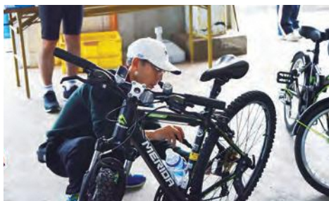
「サイクラリーとまべち」による自転車無料点検

三陸復興国立公園である階上海岸の景色や、ハマの風を感じながらの気持ちの良いサイクリングに、参加者からは笑顔があふれました。