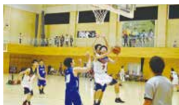
バスケットボール(男子) 対五戸町(白のユニフォームが階上町)