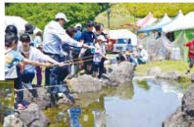
【キッズフィッシング】