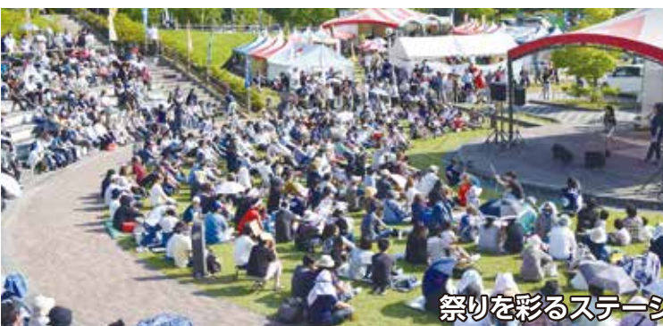
祭りを彩るステージ 観客を魅了