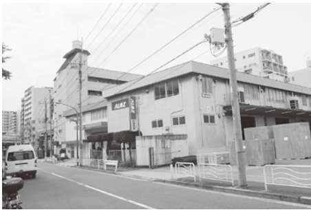
八戸藩蔵屋敷跡 (現・江東区深川)