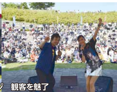
【早見優トーク&ライブ】