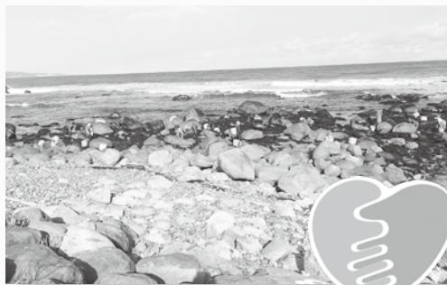
三陸ジオパーク Sanriku Geopark