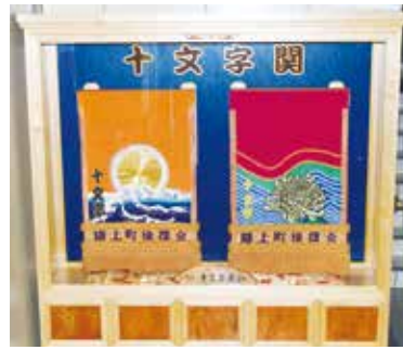
寄贈いただいた化粧廻し

い」と話されました。寄贈された化粧廻しは、ハートフルプラザ・はしかみ1階ロビーに常時展示されています。