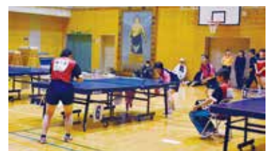
卓球(女子) 対南部町(向かって右が階上町)