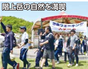
【健康ウォーキング】