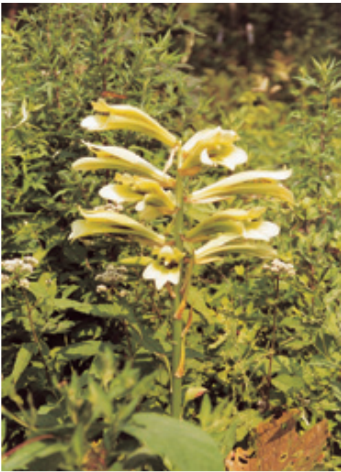
警報塔を思わせる

くなる。この葉を歯にたとえて歯がなくなることからウバユリ(姥ゆり)の名がある。地方名にはオンバユリ・ババユリ・ゴンボユリ・ヤマカゾなどがある。香りは弱く、野性味があり目立たないが品がある。