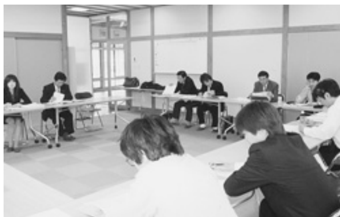
◆企画分科会の様子（南郷村朝もやの館にて）

ここで話し合われた事務事業調整案は、まとまった段階で皆さまにお知らせしていく予定です。