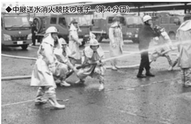
◆中継送水消火競技の様子（第4分団）