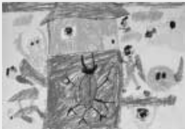
「木の上でくらしてみたい」