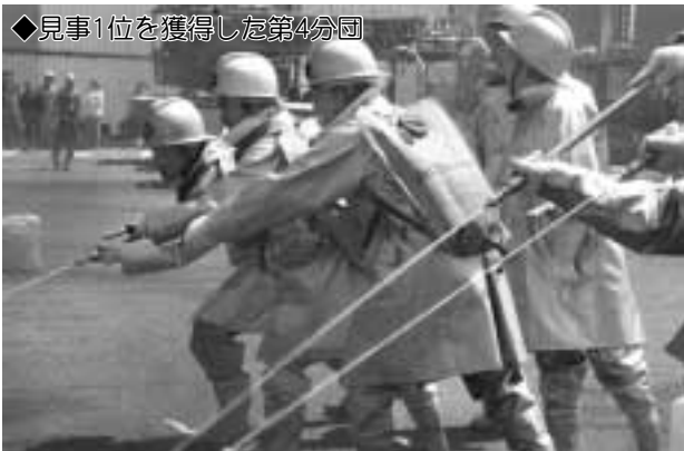
◆見事1位を獲得した第4分団

町民の皆様には、町の発展のために、さらなるご指導・ご支援を賜りますようお願い申し上げます、就任の挨拶といたします。