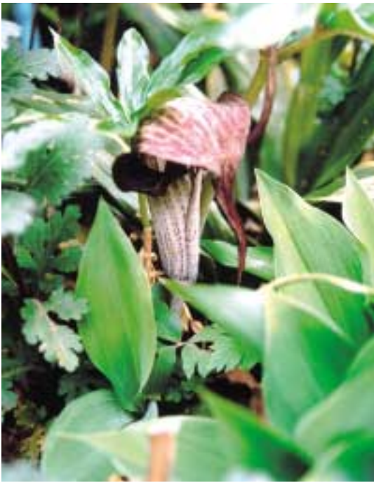
花から長く伸びる細い紐

浦島太郎の釣竿にたとえついたりとも、包を亀の甲に見立てついたりともいわれる。球茎が大きいものは雌花を、小さいものは雄花をつける。栄養によつて性が左右される。呼び名もいろいろあり、シャツポバナ・ヤマコンニャク・ヘビノボヅラなどがある。