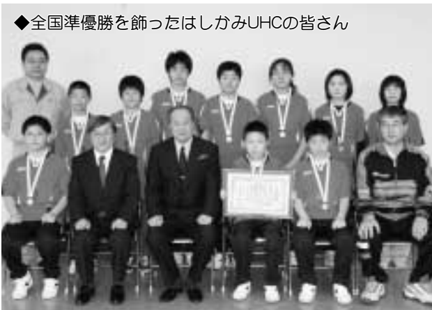
◆全国準優勝を飾ったはしかみUHCの皆さん

4月11日、はしかみUHC（ユニバーサルホッケークラブ）が来庁し、3月に千葉県浦安市で開催された第19回ユニバーサルホッケー全国大会小学生高学年混成の部の結果を上山町長に報告しました。