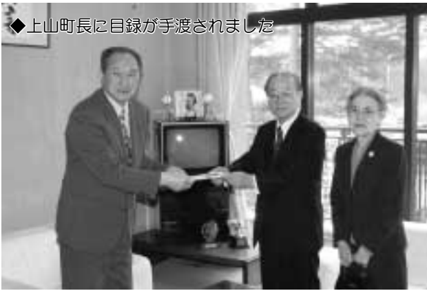
◆上山町長に目録が手渡されました