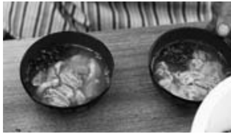
◆大好評のいちご煮（写真上）と元祖いちご煮（写真下）