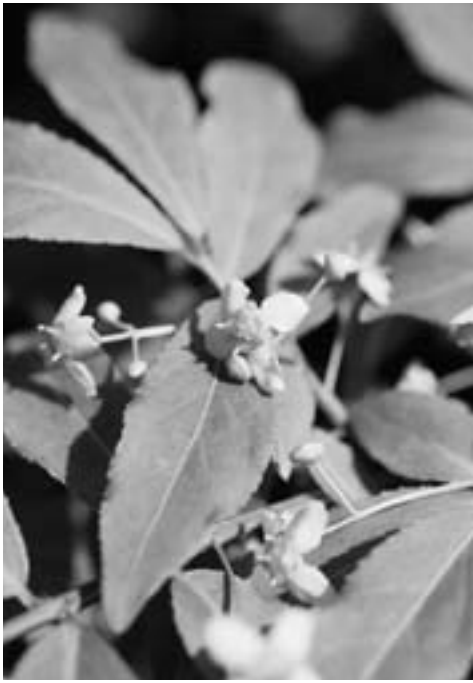
紅葉がことのほか美しい

和名は、紅葉の美しさが錦に例えられたもの。県南地方では「ママパチギリ」と呼ばれ、耳状の物を継母に抓られた跡のようだからという。