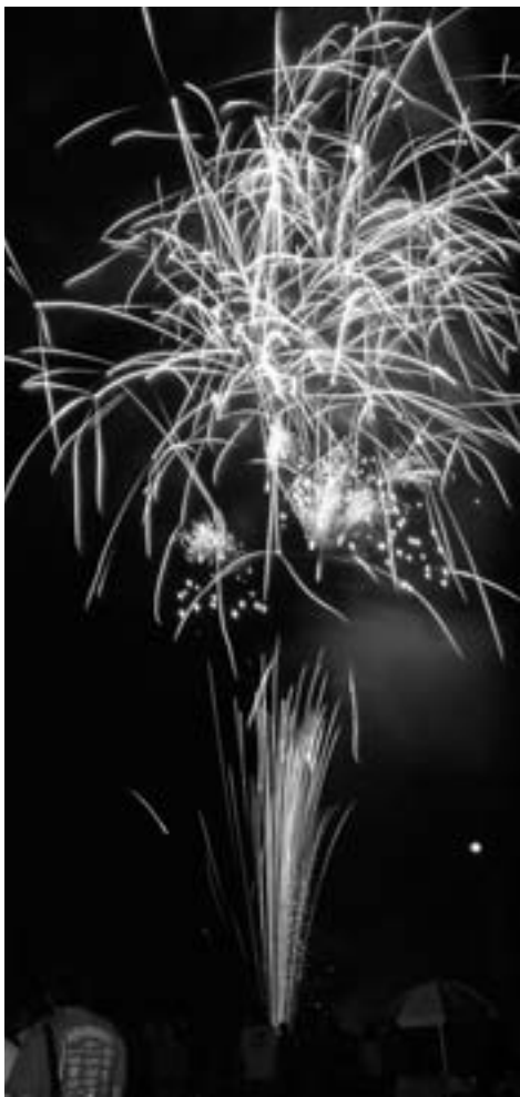
◆夜空に大輪の花が咲く