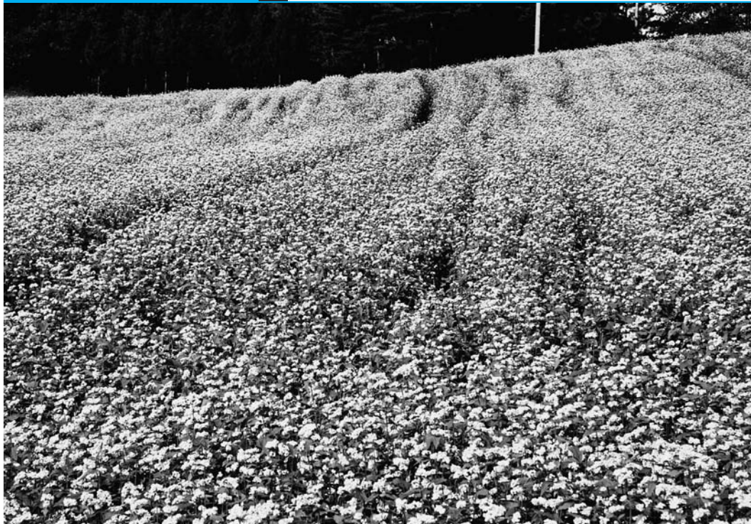
※実際の写真はカラーです

平成18年度に開催された、第3回階上町観光協会フォトコンテスト入選作品をご紹介します。 今年度も第4回を開催しますので、皆さん奮ってご応募ください。 ※応募方法は広報6月号を参照してください。