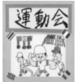
◆児童制作のポスター

この頑張りを支える支援員の増員を今後の状況を見ながら検討していきたいと考えています。