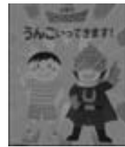
『うんこいってきます!』

スギヤマカナヨ 作/佼成出版 学校や保育園で、うんちに行きたくなったらどうする? みんなきっと悩んでる。でも、誰でもなれるんだ!“うんこヒーロー”に!恥ずかしがらずに君も、“うんこヒーロー”をめざせ!!