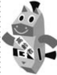
高齢者を交通事故からまもるくん

いてみたいことはありますか? お気軽に声をかけてみてください。多数のご来場をお待ちしております。