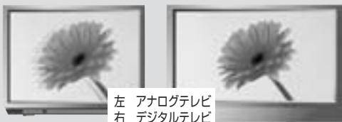
左 アナログテレビ 右 デジタルテレビ

横長のワイド画面、ハイビジョンの高画質。ゴーストもなく、今までのテレビ放送よりも美しい映像が楽しめます。