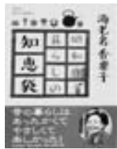
『昭和暮らしの知恵袋』

海老名香葉子 監修/家の光協会 楽しくて役に立つ知恵が満載。番茶に塩を入れてうがいをすると風邪予防になる!窓拭きは曇りの日に新聞紙を使ってこする!色落ちそうな洗濯物には酢を入れる!などなど最後まで楽しめる一冊。