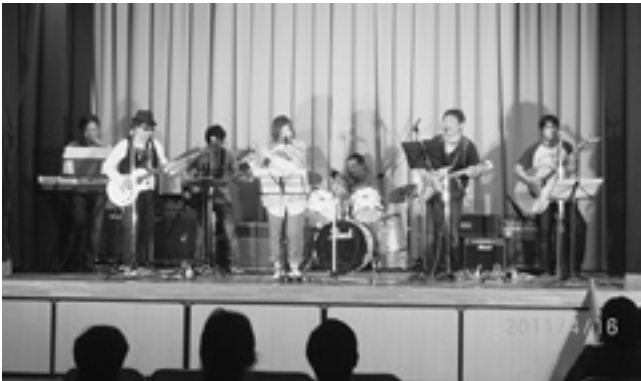
オカリナ、ロックなど多彩な演奏が披露された

町内在住者や勤務している人たちのグループ5団体が出演。大勢の来場者が足を運び、演奏に耳を傾けました。また、この日集まった募金は、後日義援金として町に寄付しました。