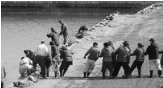
(上) 大蛇地区一斉ごみ拾いのようす (下) 港内にたまった漁具等を引き上げる部会員ら