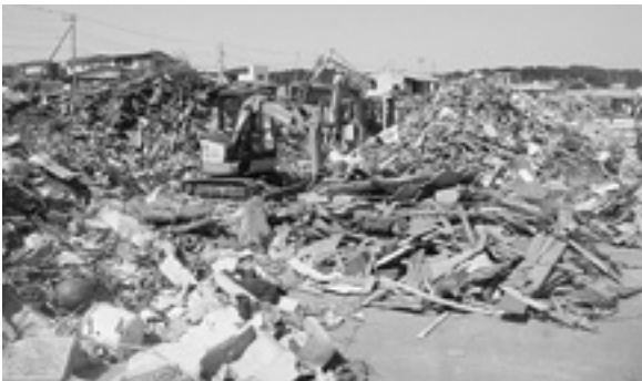
災害ごみ処理のようす(大蛇漁港)