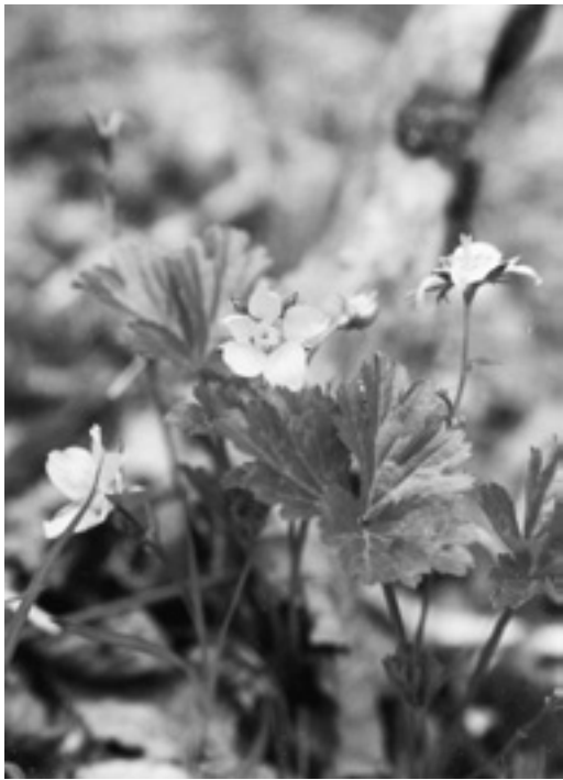
花は金色で梅の花に似る