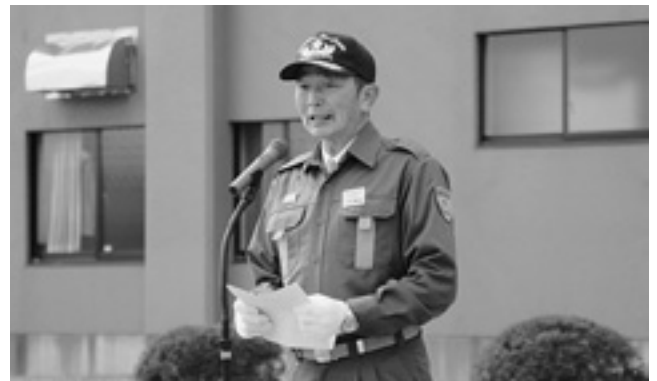
訓示をする内城団長

また、新たに入団した団員2人に辞令を交付。団員らは無線通信訓練などを行い、消防団員としての自覚を新たにしていました。