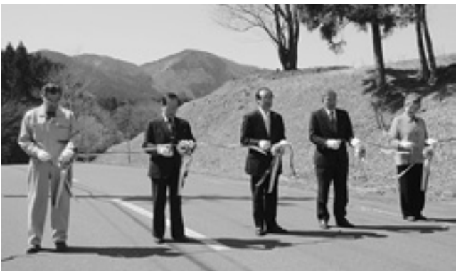
テープカットをする関係者

階上岳の入山者は年々増加傾向にあり、昨年度は約6万人。好天に恵まれたこの日も早速登山者が入山し、本格的な行楽シーズンの始まりとなりました。