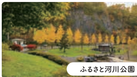
ふるさと河川公園

松館川沿いにある石灰岩に囲まれた公園で、水遊び場や水車小屋のある親水広場、バーベキューやキャンプ(区画サイトなし)が楽しめる多目的広場、遊具を備えた遊戯広場があります。公園内を流れる川で、イワナの魚影を見かけることもあります。