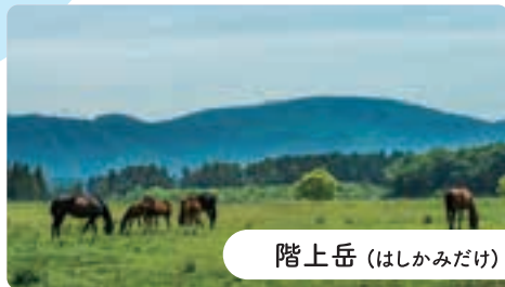
階上岳 (はしかみだけ)

標高739.6mの階上岳は、牛が寝そべっているような山容から別名「臥牛山(がぎゅうざん)」と呼ばれています。植物の種類が豊富で約400種が自生しており、中でも6月上旬に8合目付近の大開平から頂上までの「つつじの回廊」は圧巻で多くの登山者で賑わいます。