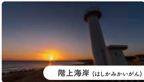
階上海岸 (はしかみかいがん)

標高739.6mの階上岳は、牛が寝そべっているような山容から別名「臥牛山(がぎゅうざん)」と呼ばれています。植物の種類が豊富で約400種が自生しており、中でも6月上旬に8合目付近の大開平から頂上までの「つつじの回廊」は圧巻で多くの登山者で賑わいます。