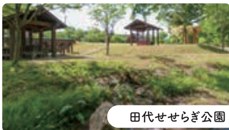
田代せせらぎ公園

松館川沿いにある石灰岩に囲まれた公園で、水遊び場や水車小屋のある親水広場、バーベキューやキャンプ(区画サイトなし)が楽しめる多目的広場、遊具を備えた遊戯広場があります。公園内を流れる川で、イワナの魚影を見かけることもあります。