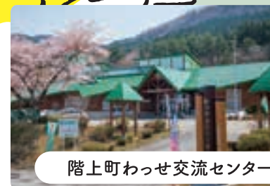
階上町わっせ交流センター

地元の野菜や海産物、手作り加工品、スイーツ、お土産が一堂に勢揃い。実演コーナーでは手作りのヨモギ餅や饅頭なども販売しています。またレストランやミニショップも併設しており、郷土料理など様々な味が楽しめます。