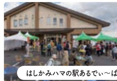
はしかみハマの駅あるでい〜ば

階上岳の西登山口にある公園で、名称の由来は田代川の「せせらぎ」から。公園内には屋外バーベキュー施設やトイレが整備されています。川沿いにせせらぎ遊歩道があり、夏になるとホテルが舞い幻想的な夜を楽しめます。