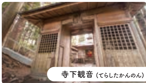
寺下観音 (てらしたかんのん)

階上町は巨木の郷と言われるくらい町内に国内や県内最大級のもの10本以上もあり、全国的にも珍しいケースです。それも山奥ではなく社寺の御神木や民家の庭など身近な生活空間にあり、見学しやすいのが特徴。巨木めぐりツアーは人気のイベントになっています。