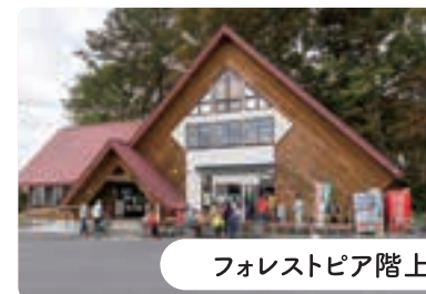
フォレストピア階上

新鮮で旬な魚介類や水産加工品を安く買えるお店。町の魚アブラメやヒラメ、ドンコ、ウニ、秋鮭など季節によって販売する魚種が変わります。また漁協婦人部のフリドーナッツや、レストランでは海鮮料理などが味わえます。