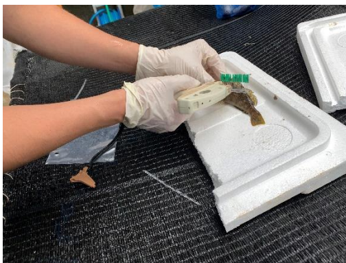
標識付け作業風景

アブラメの生育状況や回遊範囲等を調査する目的から、今年度も標識タグ（アンカータグ）を稚魚に装着し放流しました。標識付けについては八戸水産高校栽培実習場で実施し、今年度もアンカータグを約1,000尾の稚魚に装着後、9月6日に小舟渡漁港沖合において放流を行いました。今回は緑色のアンカータグを装着し、採捕された際に、何年度に放流されたか分かるように区別しています。