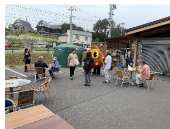
祭り風景(あぶらめくん)