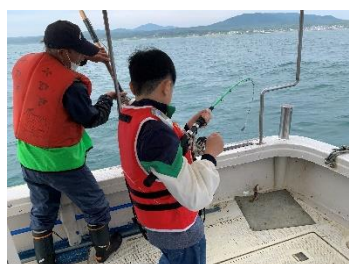
アブラメを釣り上げる児童①

アンケートから、次回開催を望む声も多く、アブラメや漁業に直接触れることができる貴重な体験の場であると考えられます。