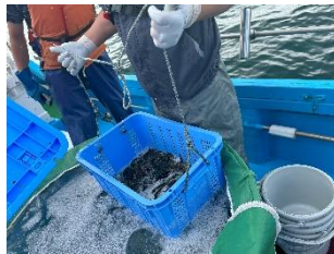
かごに分けている様子

これまでは放流後の潜水調査で確認されなかった標識アブラメが、3尾確認されたとのことで、今後の資源増加に期待されます。