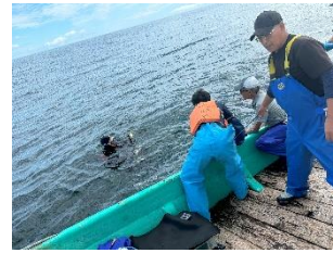
ダイバーにかごを渡している様子