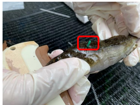
令和6年度は緑タグ