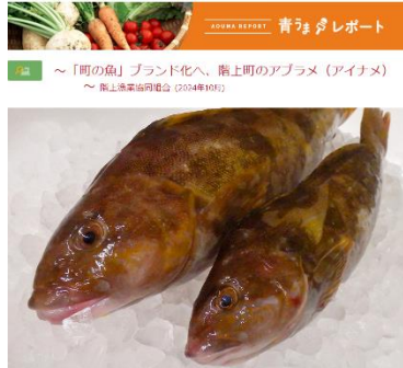
掲載サイト「青森のうまいものたち」

イベントの実施や広報誌等を活用し、PR を実施しました。また、青森県食ブランド・流通推進課から声掛けがあり、あおもり産品情報サイト「青森のうまいものたち」の【あおうまレポート (2024 年 10 月)】にアブラメの記事が掲載されています。こちらは町内漁業者に取材対応していただいたもので、今後も、協議会員の皆様や漁業者自ら PR できる体制を整備したいと考えています。