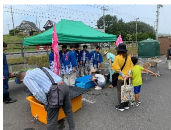
祭り風景(水産高校)