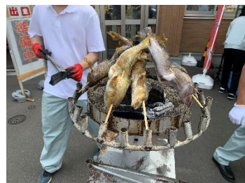
アブラメ一本まんま焼き

また、当日は、八戸水産高校、八戸工業大学第高等学校生徒に専用ブースでのPRや、イベント補助をしていただきました。