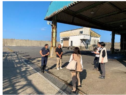
漁業者の取材対応