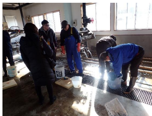
左：1回目研修会 右：2回目研修会