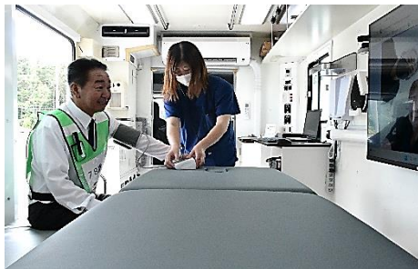
診察のデモンストレーションの様子