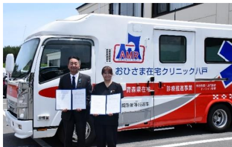
荒谷町長と井上院長が協定書を締結しました