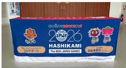
株式会社河原木電業 様 テーブルクロス 1枚