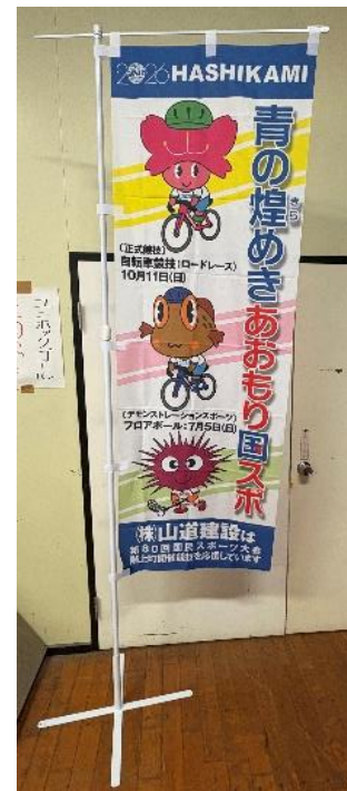
株式会社山道建設 様 のぼり旗一式 12セット