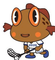
[はしかみキッズ:あぶらめくんフロアボールver]