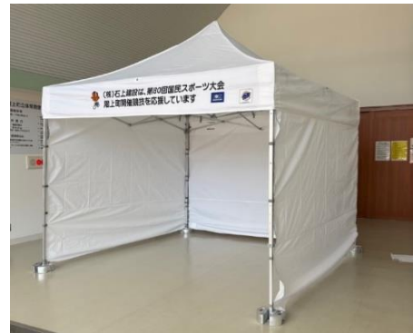
株式会社石上建設 様 ワンタッチテント 一式