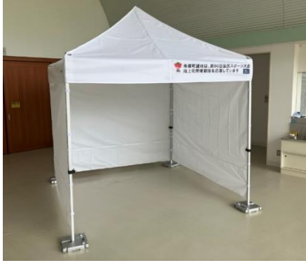
株式会社横町建材 様 ワンタッチテント 一式