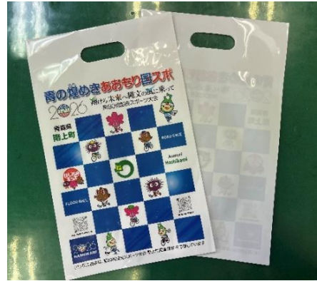
有限会社森工務店 様 プロモバッグ 500枚