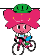
[はしかみキッズ:つばひ姫ロードレースver]