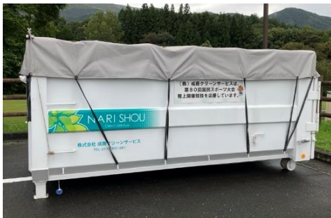
株式会社成商クリーンサービス 様 廃棄物回収用コンテナ設置