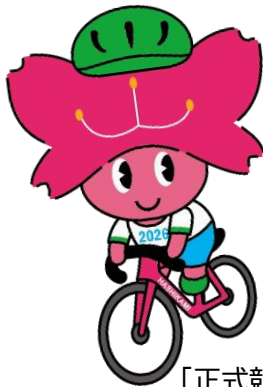
[正式競技] ロードレース