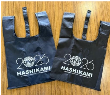
有限会社熊谷保険事務所 様 エコバッグ 120個