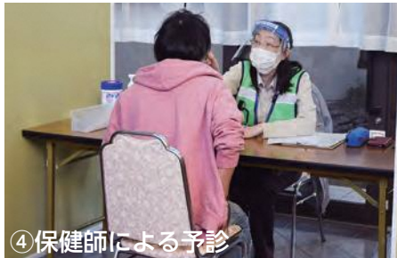
④ 保健師による予診