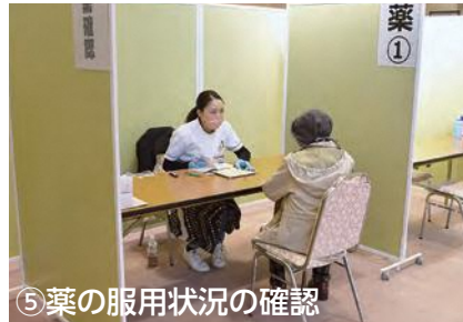
⑤ 薬の服用状況の確認