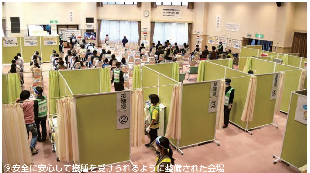
⑨ 安全に安心して接種を受けられるように整備された会場