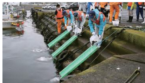
標識の付いたアブラメを放流する生徒