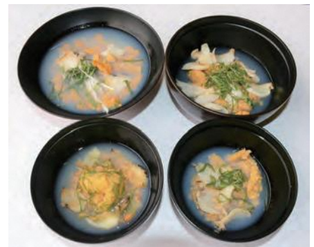
4店舗で提供された個性豊かないちご煮

また、東日本大震災から10年の節目に未来への希望を込めた「夏の元気玉～HANABIリレー」も開催され、4カ所の地点からリレー方式で打ち上げられたサプライズ花火が、夏のハマを彩りました。