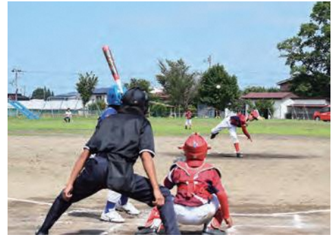
【写真左】中学校ソフトテニスの部、【写真右】小学校野球の部