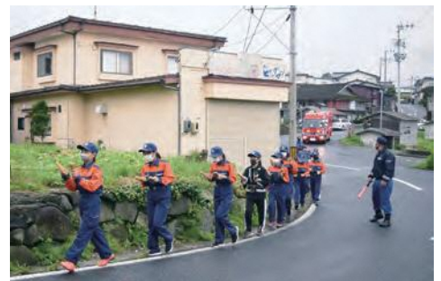
拍子木を持ち広報活動するクラブ員