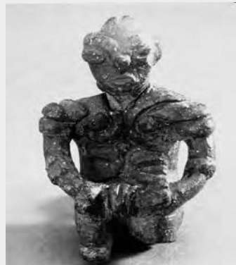
滝端遺跡出土の膝を抱える土偶

なお、右のURLやQRコードからも町ホームページの「遺跡発掘」の情報をご覧いただけます！