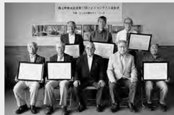
◀ 第17回フォトコンテスト表彰式

令和2年度第17回コンテストには、31点の応募があり、厳正な審査の結果、最優秀賞1点、優秀賞2点、入選3点、特別賞1点が選ばれました。受賞作品は「フォレストピア階上」で展示していますので、ぜひご覧ください。