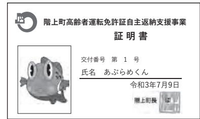
※交付している証明書