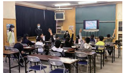
道仏小学校での租税教室の様子

また、授業の後半では約10kgの1億円の見本を児童たちが交代で持ち上げ、その重さに驚きの表情を見せていました。