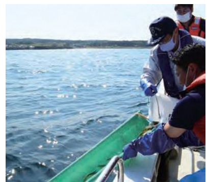
「シューター」を使用したアブラメ稚魚放流の様子

今後は、八戸水産高等学校の生徒と追跡調査用の標識タグを付けた稚魚を約3,000尾放流するなど、稚魚放流を継続し、安定した資源確保に向け取り組んでいきます。