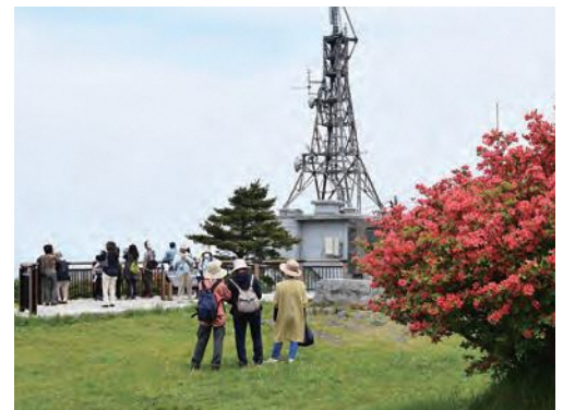
階上岳大開平でつつじを觀賞する来場者

また、新月の6月10日には、階上岳の麓でサプライズ花火を打ち上げる「春の元気玉～HANABIリレー」を開催。新型コロナウイルス感染症終息を祈願して町内3カ所の地点から打ち上げられ、階上岳の夜空に大輪の花を咲かせました。