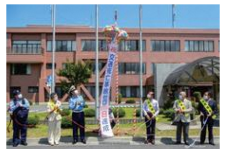
くす玉を割る関係者