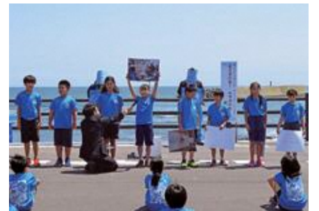
商品ができるまでを紹介する小舟渡小児童

同日は、はまゆりこども園の園児によるバルーンリリィスで記録の達成を祝い、関係者が今後の記録更新と交通安全に向けて決意を新たにしました。