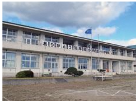
小舟渡小学校校舎

それぞれの式典では、児童たちがこれまでの学校生活の思い出などを紹介し、4月から通う道仏小学校での新生活に向け、気持ちを新たにしていきました。