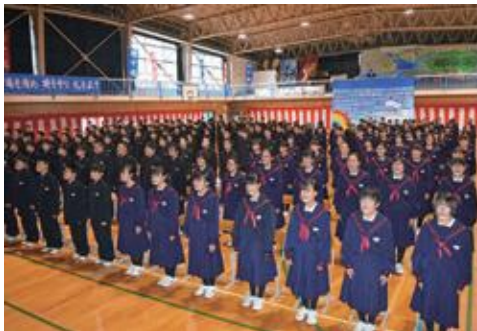
全校生徒による校歌斉唱