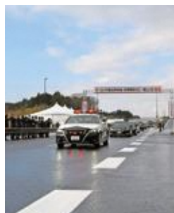
開通式後の通り初め(12月12日)