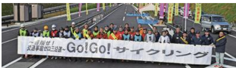
開通前の三陸沿岸道路での集合写真