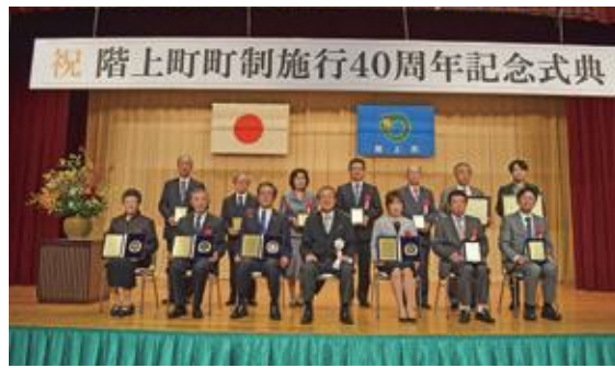
町の発展に貢献された受賞者

同日午後からは、階上町生涯学習元気まちフォーラムを開催。町では初の試みとなるリモート形式での講演・実践発表が行われました。