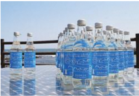
「どごさいだ〜ハマさいだ〜」

どごさいだ〜ハマさいだ〜は、小舟渡小児童が海水から手作りした『俺たちの塩』を使ってできた商品で、程よい甘さと塩味のバランスが特徴。式では、児童たちが商品ができるまでの経緯などについて紹介しました。