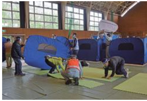
パーティションを組み立てる参加者

消火訓練や土のう積み訓練のほか、新型コロナウイルス感染症対策を踏まえ、パーティションを使用した避難所開設訓練が行われました。