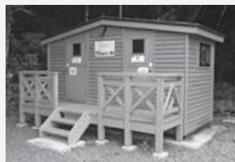
しるし平バイオトイレ