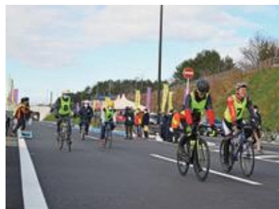
開通前の三陸沿岸道路でサイクリングを楽しむ参加者

11月29日、「GO!GO!サイクリング」が開催され、参加者は開通前の三陸沿岸道路の階上ICから県境周辺を往復し、サイクリングを楽しみました。