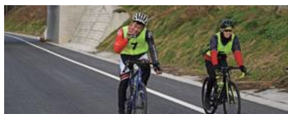
サイクリングを楽しむ参加者