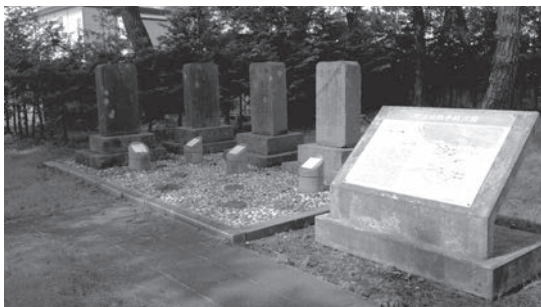
野辺地戦争戦死者の墓所 (野辺地町字鳥井平)

明治元年(1868)9月、戊辰戦争の中でも最大の戦場であった会津戦争が会津藩の降伏により、旧幕府軍側が函館五稜郭へ渡ったことで東北での戦争はほぼ終結します。しかしこの時、青森で一つの戦闘が起こりました。野辺地戦争です。22日夜、新政府軍に盛岡藩討伐を命じられていた弘前藩が野辺地に出兵、三隊に分かれ、本隊は馬門村に火を放って野辺地村に進