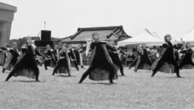
◆トートーチームによる臥牛ソーラン