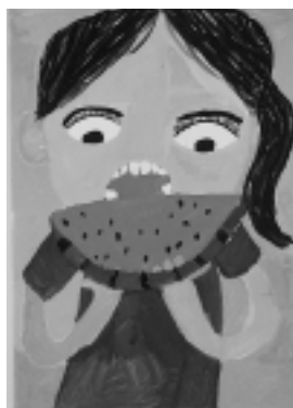
「すいかを食べてる私」