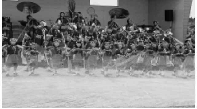
◆小舟渡小学校の元気な「沖揚げ音頭」