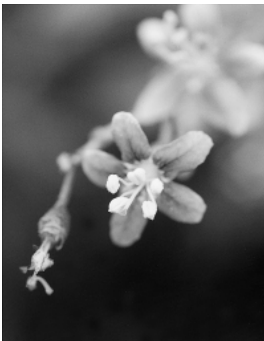
葉の形がスッポンの甲羅に似る

センチほどの果実をつけ、中には三センチほどの白い毛をもった種が入っている。この長い毛がパラシュートの役割を持っていて、種は風に乗って散開する。和名は種子につく綿毛で鏡を磨いたことから、カガミイモから転嫁したとか。