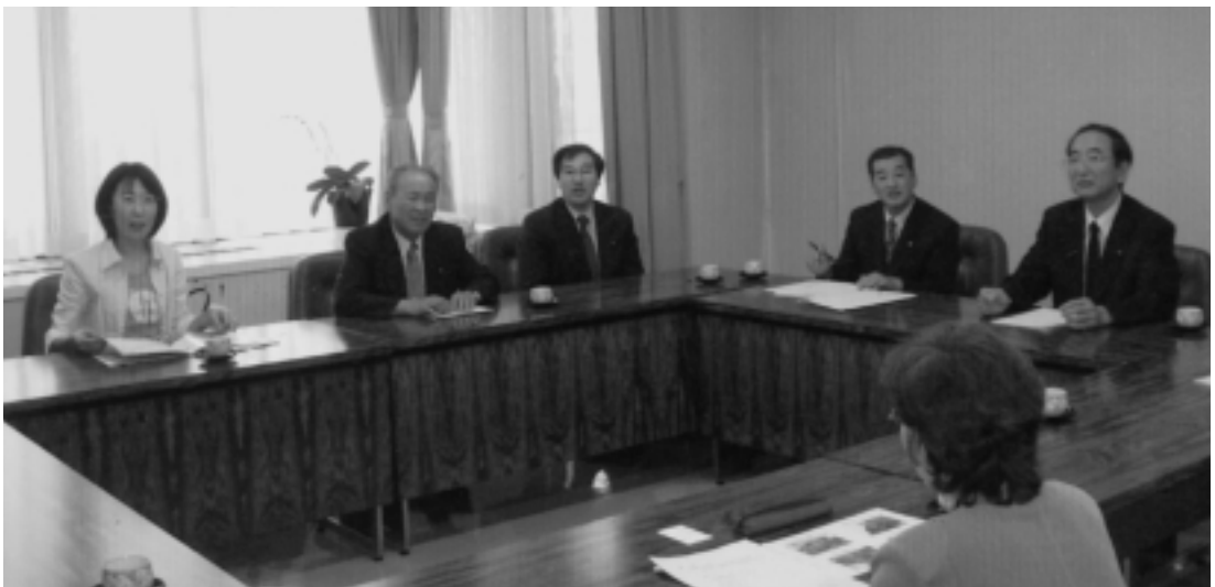
子ほめ条例について研修を受ける（国分寺町）