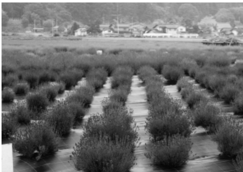
遊休地を活用して栽培されているハーブ（池田町）

の時代の、中心的役割を担うものであり、その栽培は遊休荒地や転作田の有効活用につながるのと、考えから、昭和六十三年より花とハーブによる町づくりが始まった。平成四年農家にはハーブ契約栽培を奨励し、三年間の価格保証をした。五月に（財）振興公社を設立し、町の全額出資とした。ハーブセンターは、ハーブ見本園、ハーブ観賞ハウス、店舗、レストランからなり、常時二百種類以上のハーブを観賞できるようにした。ハーブセンターでは、商品開発をし、ハーブ茶や、入浴剤、シャンプー、石鹸等の販売