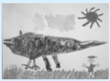
「ティラノサウルス」