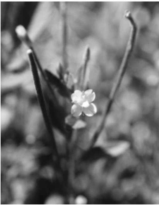
可憐な花を咲かせる

の毛がある。秋おそくには、葉腋にムカゴができることもある。分布は本州中部地方以北、北海道、高山から亜高山帯の谷間などとされる。和名は『深山アカバナ』で、さく果は長さ二く三センチぐらいで裂けて冠毛をつけた種子を風に乗せて飛ばす。