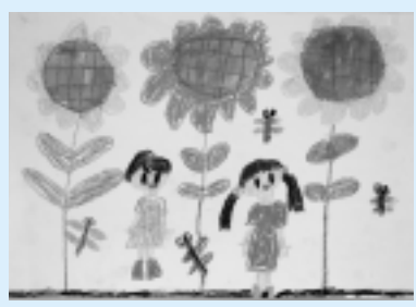
「ひまわりがさいたよ」