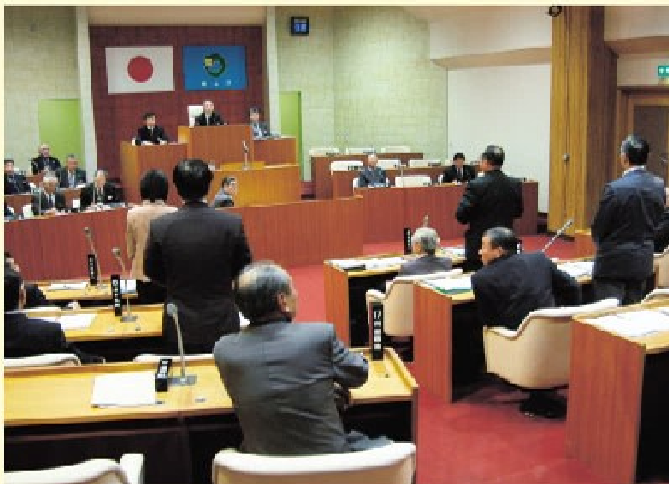
▲第二回階上町臨時議会での採決の様子

発行/階上町 〒039-1201 青森県三戸郡階上町大字迫山字天当平1-87 編集/企画課 TEL(0178)88-2913 FAX(0178)88-2917