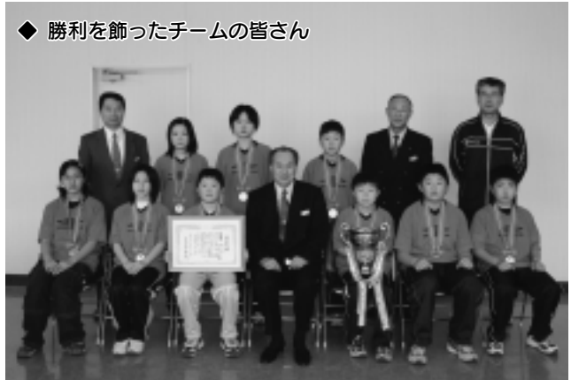
◆ 勝利を飾ったチームの皆さん

本町のチームは小学校低学年、高学年、一般、シニアといった4つのクラスのうち、一般を除く3つのクラスで栄冠を獲得しています。各チームのさらなる活躍を期待します。