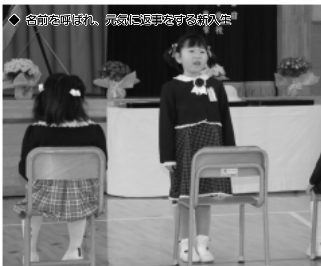
◆ 名前を呼ばれ、元気に返事をする新入生