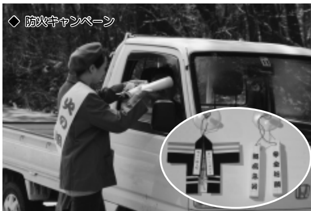
◆ 防火キャンペーン

午前8時にサイレンがなり、訓練がスタート。金山沢地区の川から水を汲み上げ、各分団が無線で連携を取り合いながら7台の消防ポンプ車を中継して火点に放水しました。