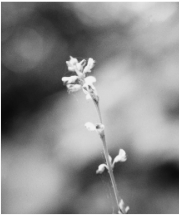
小さくかわいらしい花

らしい。実の形にも特徴があり、実は真中でくびれてサンガラスのような形をしている。この実の表面には細かい毛が生えていて、動物にくつついて遠くまで運ばれる。別名ヤマジラミ・ホレグサなどがある。