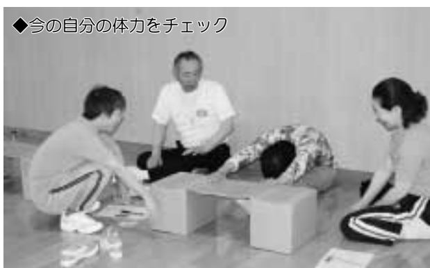
◆今の自分の体力をチェック

受講生18名は8月25日までの3ヶ月間、筋力トレーニングやエアロビクス等を通じて、楽しみながら健康な体づくりを目指します。