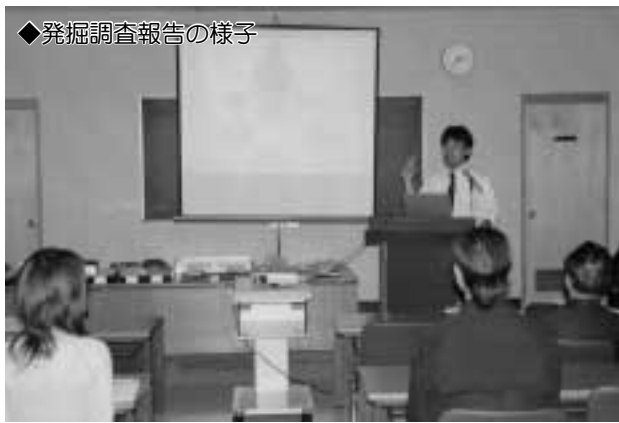
◆発掘調査報告の様子

出土した鹿角製腰飾り等の遺物は、7月から江戸東京博物館を皮切りに開催される文化庁主催の「発掘された日本列島2005」に出展されます。