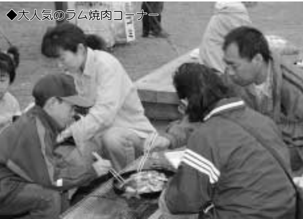
◆大人気のラム焼肉コーナー