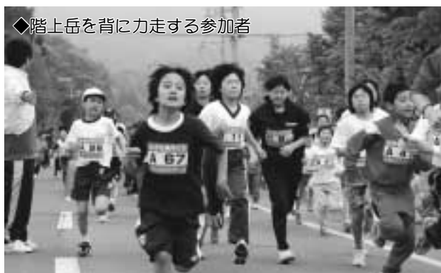
◆階上岳を背に力走する参加者