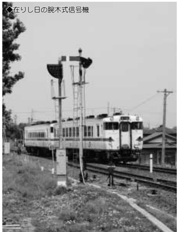
◆在りし日の腕木式信号機

階上駅の信号機はこの撤去により、青・赤信号で進行を指示する色灯式に更新されましたが、方式は違って電車運行の安全を守ってくれることでしょう。