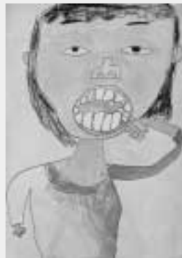
「わたしの歯、ピッカピカ！」