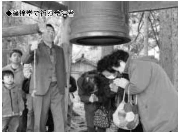
◆鐘撞堂で祈る参拝者