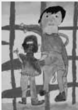
「ジャングルジムにのぼったよ」