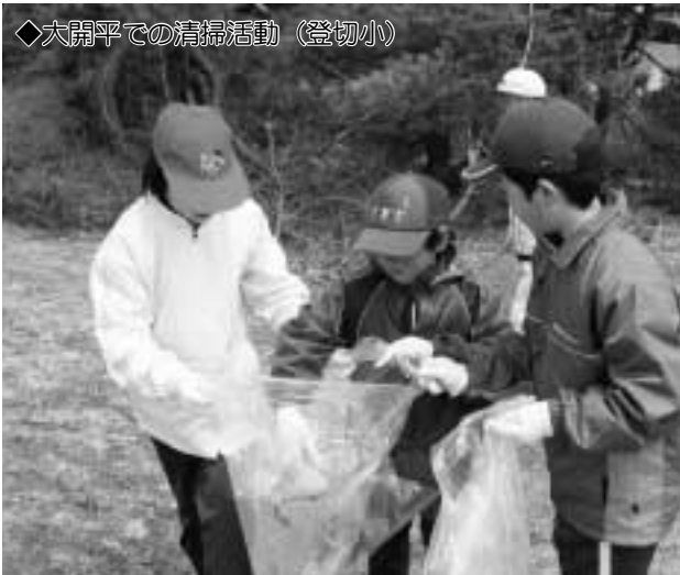
◇大開平での清掃活動（登切小）