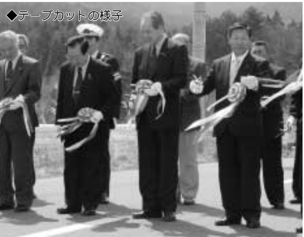
◆テープカットの様子

階上岳は四季を通じて誰でも楽しめる山ですが、自然を甘く見ず、十分な準備をしてから入山しましょう。