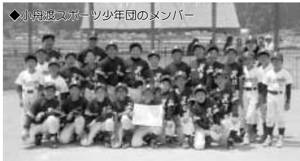
◆小舟渡スポーツ少年団のメンバー