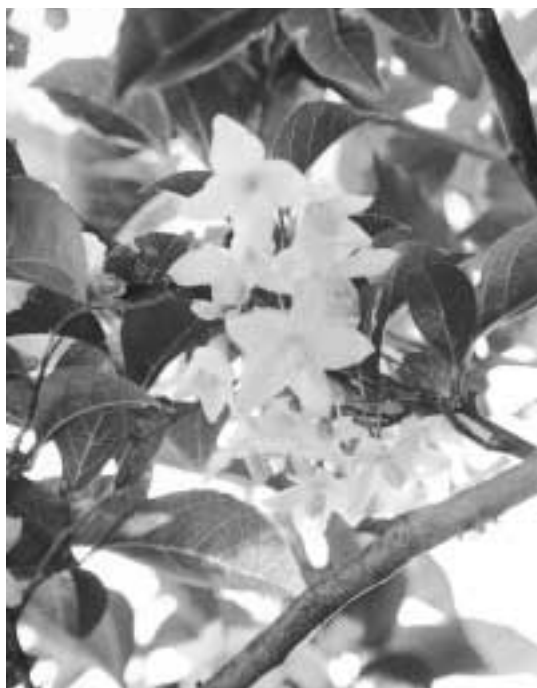
白花を総状につける

洗濯に利用したのでセンタクノキとも呼ばれていたという。乾果は球形または卵形をしていて、種子は茶褐色。材は細工物や櫛、将棋の駒などに利用するという。別名として、『杓子木』、『山桐』などがある。