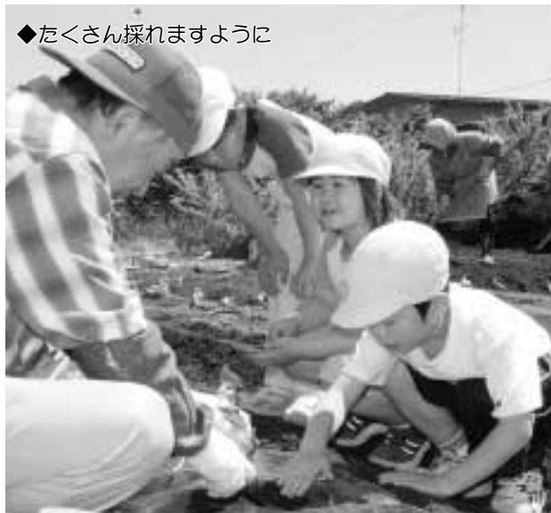
◆たくさん採れますように

児童らは収穫を心待ちにしながら苗植えの他、畝づくりや、ジョーロを使っての水やり等、丁寧に作業をしていました。