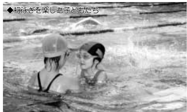
◆初泳ぎを楽しむ子どもたち